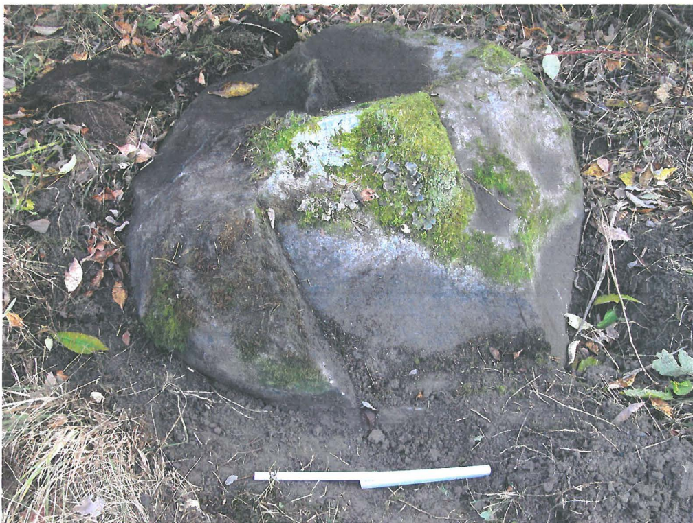
Viikinkiaikaisen kirveen löytöpaikan vieressä oleva maakivi. Mitta 40 cm.