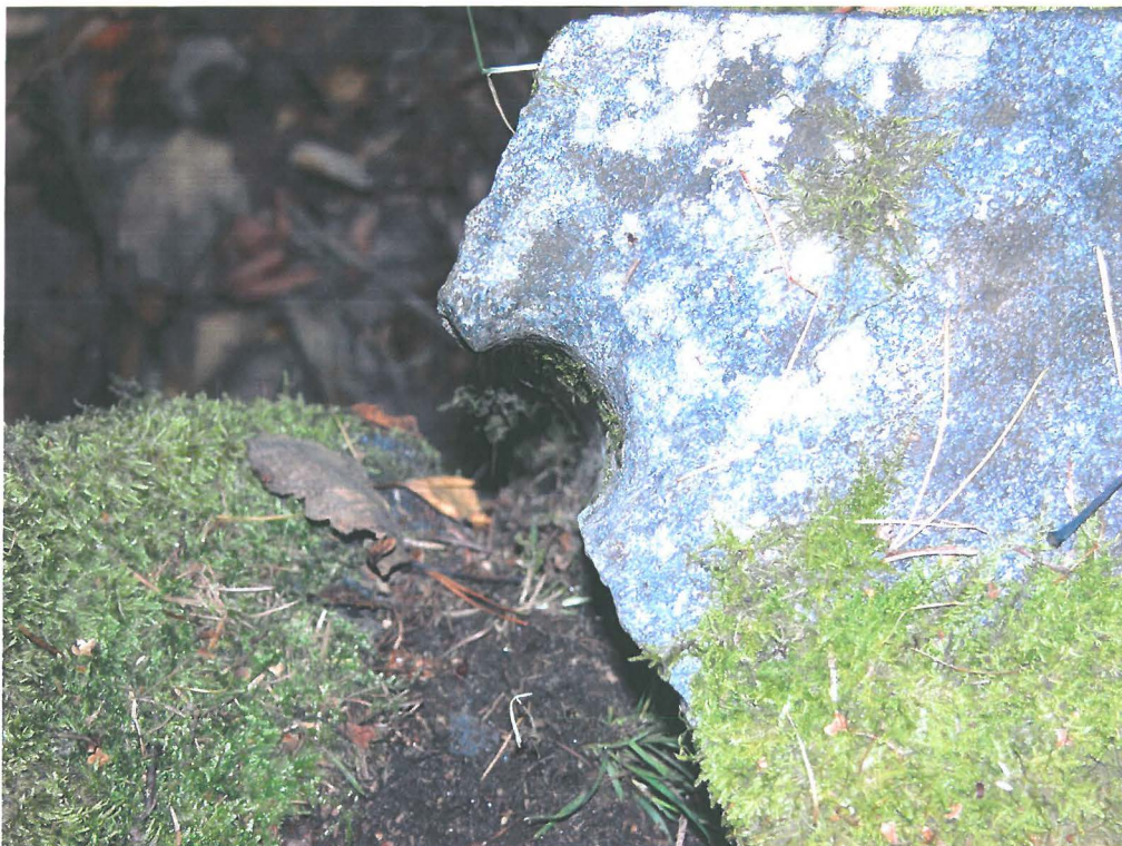
Porauksen jälki kivilohkareen reunassa.