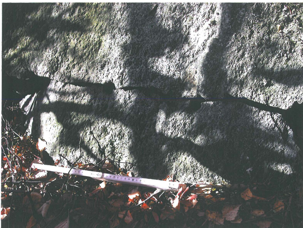
Kivi jossa porauksen jälkiä. Mitta 40 cm.