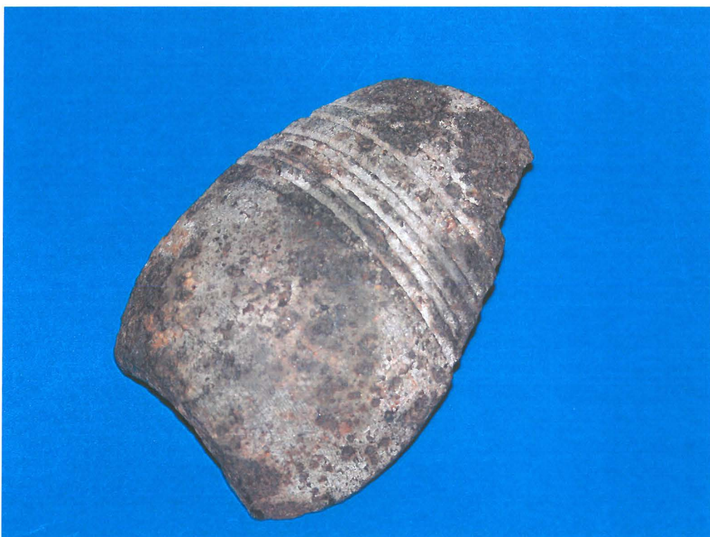
Metalliesineen katkelma.