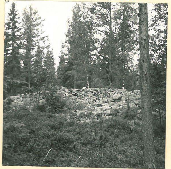
Sama kuin ed.