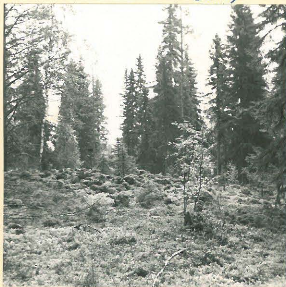
Sama kuin ed.