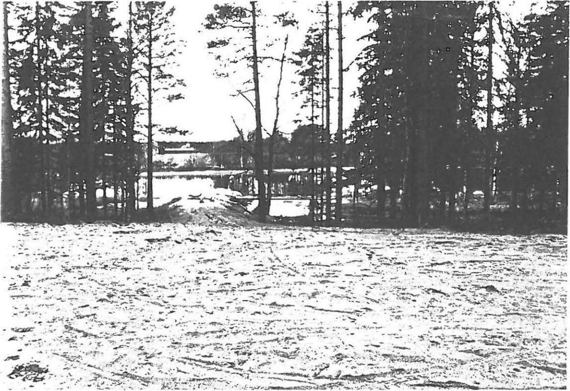
Kuva 3. Laiturin pohja. Oikealla hämöttää pieni tekosaari. Kuvattu raivatun alueen kaakkoisosasta kohti länttä.