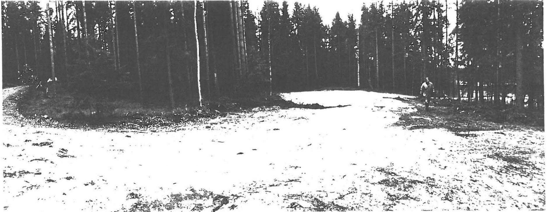
Kuva 2. Näkymä kuoritun alueen pohjoispäästä etelään. Vasemmalla auton kohdalla ylempi törmä. Taka-alalla oikealla häämöttää laituriin pohjaa. Oikealla Pihtiputaan ympäristösihteeri Veijo Peltola.