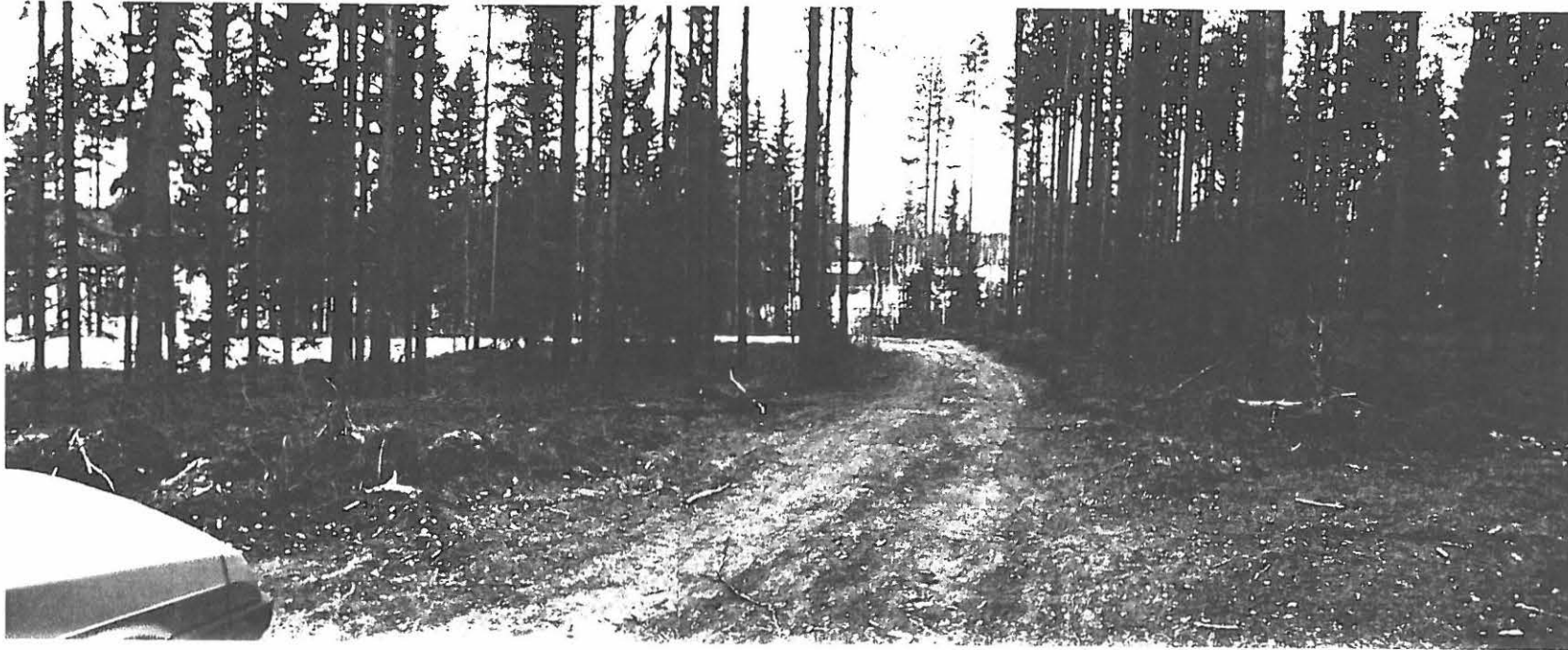
Kuva 1 Näkymä ylemmältä törmältä länteen. Alemmalla tasolla keskellä ja vasemmalla kesämökin tontiksi raivattua, kuorittua aluetta Asuinpaikkalöytöjä kaikkialta kuoritulta alueelta ja tienpohjasta.