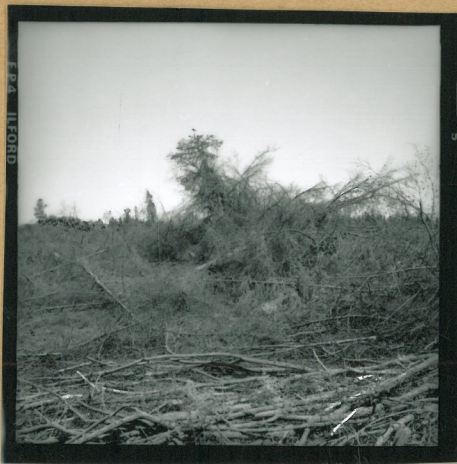
Raunio 3 (risukasen alla)