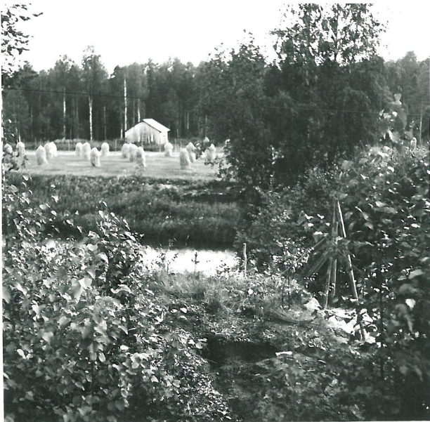
Löytökohte muuan alarunassa oikeassa puolekossa, keskellä Kiskojoki, kuvattu idästä.