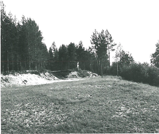
Multavierun aluepiikka, kuvattu pohjoisesta. Löydöt (K/M 18275 ym) piikkakuopan takana, josta haudat väsimällä.