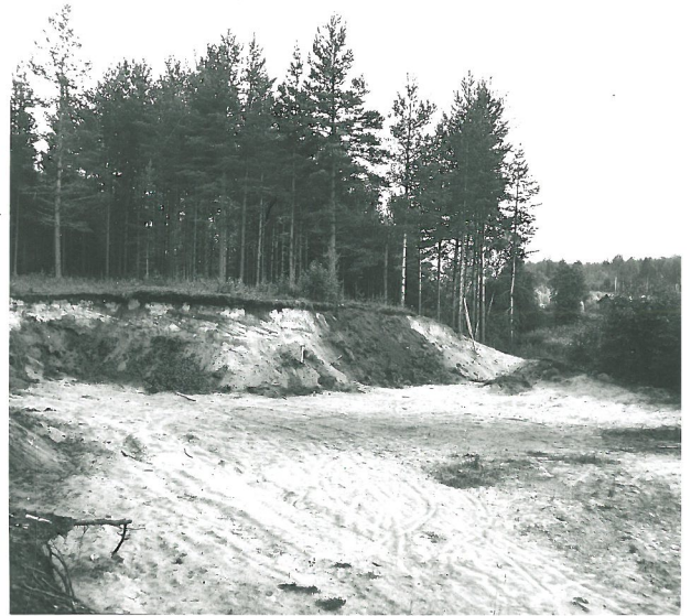
Multavierun löytöpiikka piikkakuopan reunassa tumman hoidalla, kuvattu pohjoisesta.