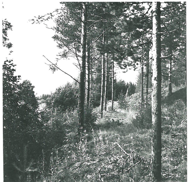
Multavierun aluepiikka, Kiskojoki vasemmalla, piikkakuoppa löytöpiikan takana, kuvattu idästä.