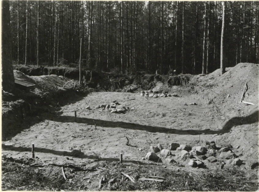
V:n 1934 kaivausalue paljas- tettuina liesimön. Valok. S. 80:sta Levy 9534.