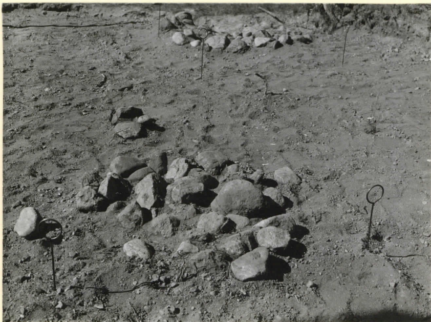
Liesi N o 2 (taustalla N o 1) S 80:sta päin. Levy 9536.