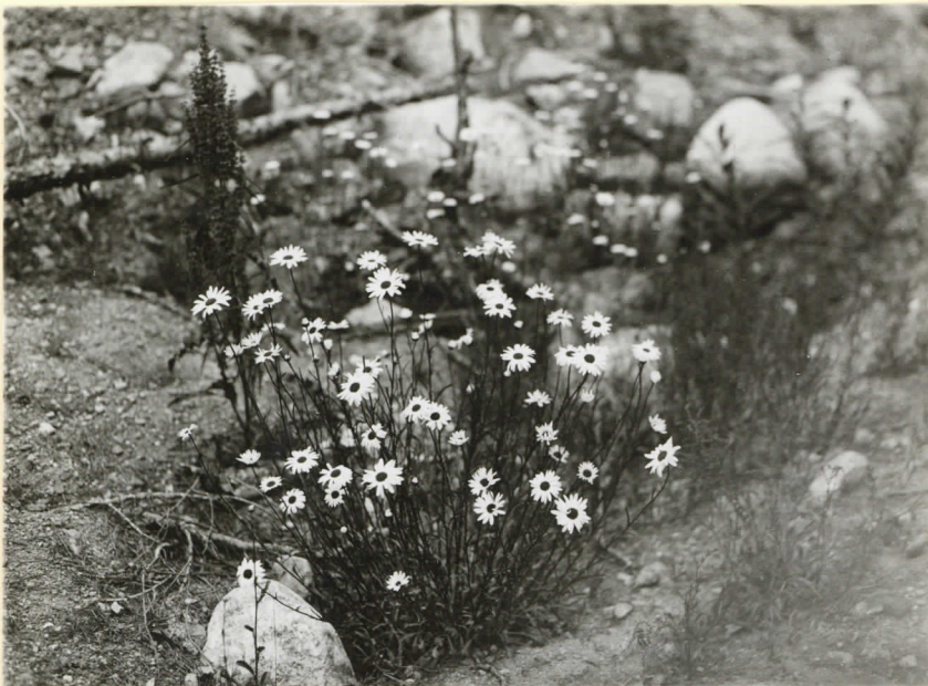
„Löytöjä” sorakuopan pohjalta. Levy 9537.