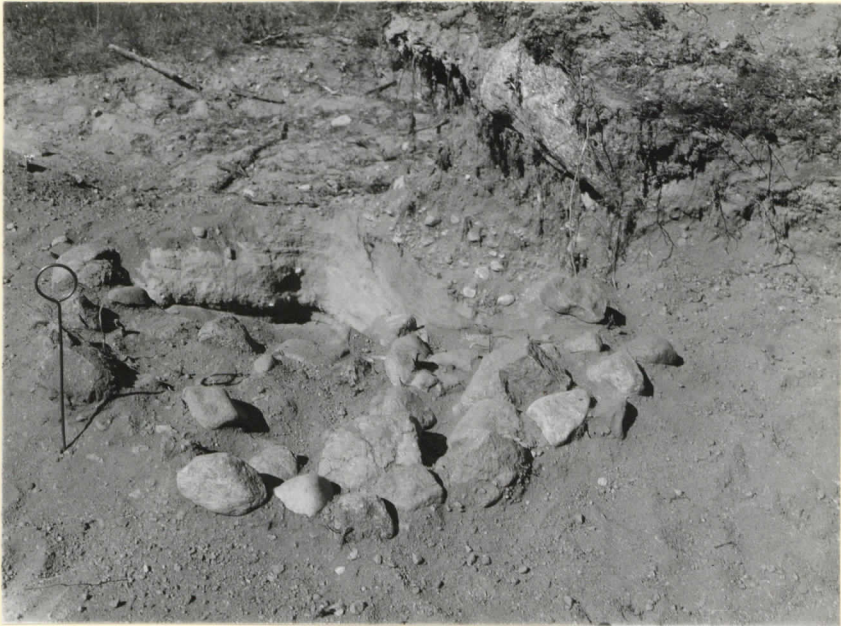
Liesi N o 1 (pohjoisin) S 80:sta päin. Levy 9535.