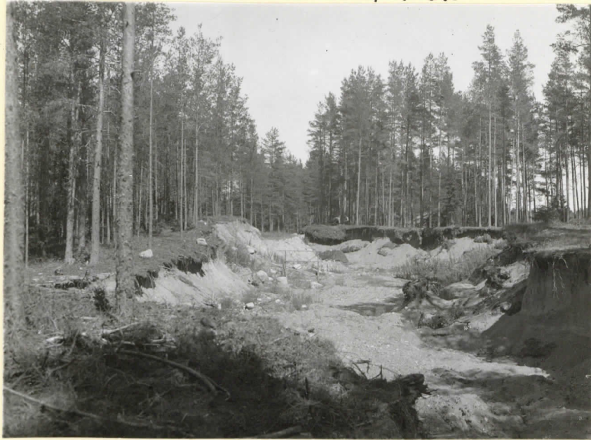
Pitulannumman sorakuoppa valok. S-SW:stä päin. Levy 9533.