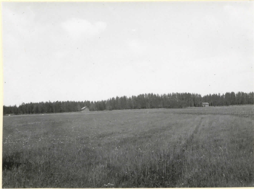
Pitulannummi S:stä päin. V. 1934 kaivausalue lähellä oikeanpuoleista latoa. Kuva st. Wikmanin alueen pika- maan reunalta. Levy 9532.