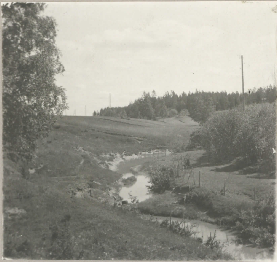
Kerolan kivik. asuinpaikkea länneestä. Kaiwaus molen kohdalla metsänkäryn kohdalla.