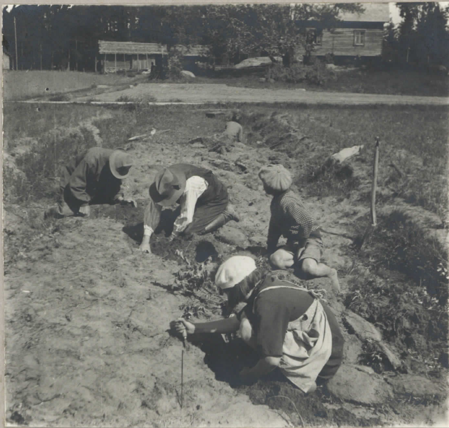
Kerolan asuinpaikan kair. Takan Kerolan rakennuksia