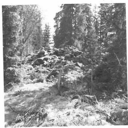
4. SAT. MUS. NEG. 16367 FIL. LIS. U. SALON TARK. KERT. RAUNIO 6