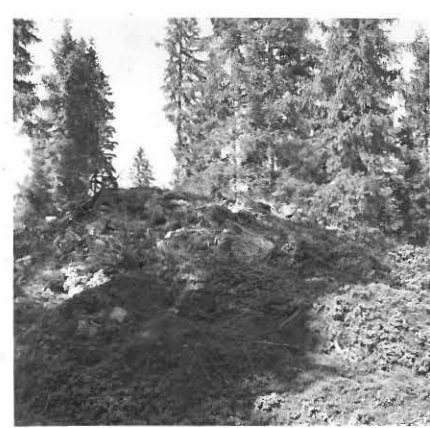
6. SAT. MUS. NEG. 16370 FIL. LIS. U. SALON TARK. KERTO- MUKSEN RAUNIO 11.