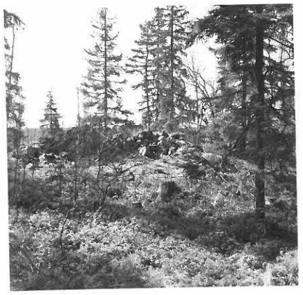
3. SAT. MUS. NEG. 16366. FIL. LIS. U. SALON TARK. KERTOMUKSEN RAUNIO 3.