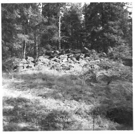
2. SAT. MUS. NEG. 16363 MAIST. A. KOPISTON LUETTELOON RAUNIO 1.