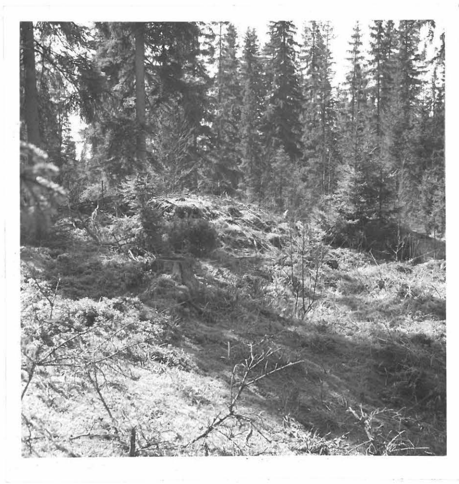
5. SAT. MUS. NEG. 16369 FIL. LIS. U. SALON TARK. KERT. RAUNIO 8.