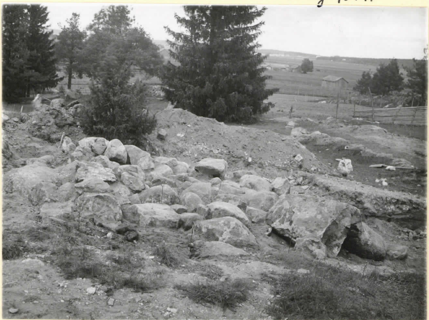
Paimion Herrankartanon ruuninperusta paljastettuna. Kuva P:stä päin. Levy 9515. E. Kivikoski-34