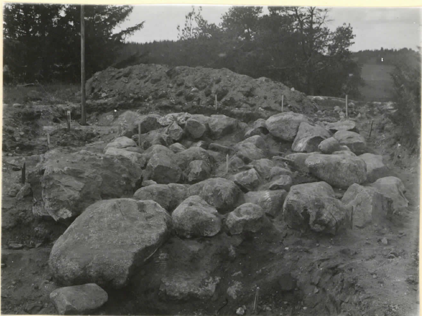
Paimion Herrankartanon ruuninperusta paljastettuna. Kuva P:stä päin. Levy 9514.