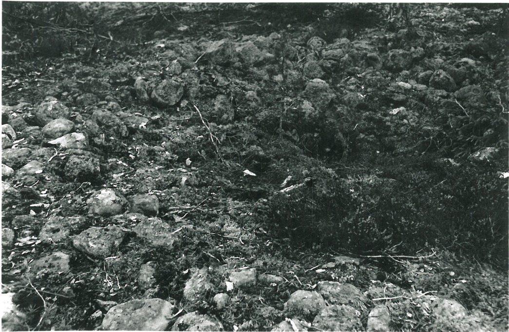
RÖYKKIÖ, KESKELLÄ KRAATERI