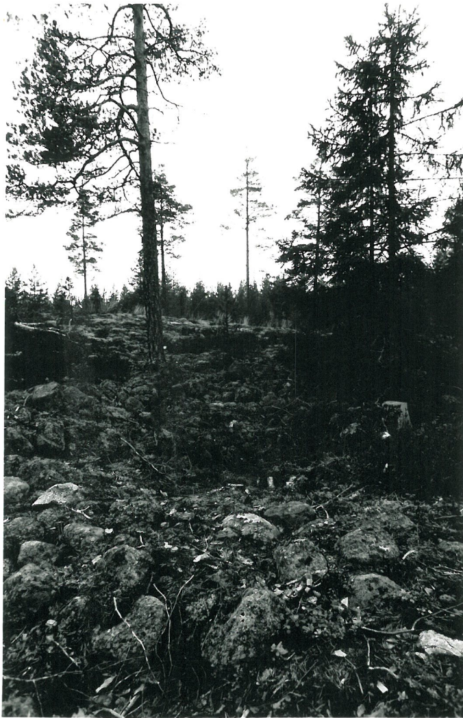
RÖYKKIÖ, YLEISKUVA, KALLIOALUE TAUSTALLA, KAIKKI VALOKUVAT KARTALLA KOHDE 3