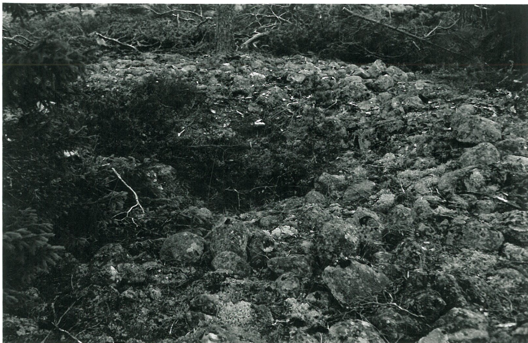
RÖYKKIÖ, KESKELLÄ KRAATERI