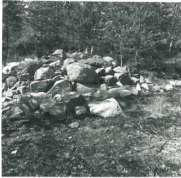
F. 33780 Arkkullinen raunio maanpäällä. Soppo Vöyään mukaan Pukkilan Kirkonkylän Peräarossa.