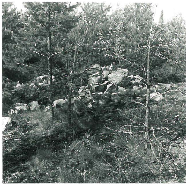
F. 33781 Sama luonnyllä.