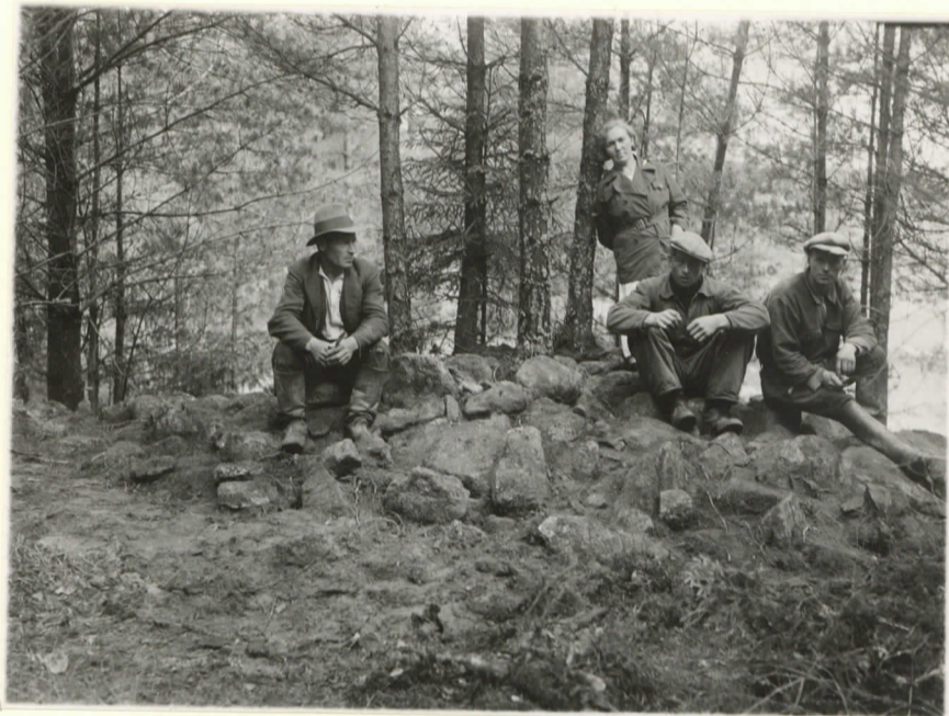
1. Röykkiö d ennen kaivausta. Valok. N.N.W:stä päin.