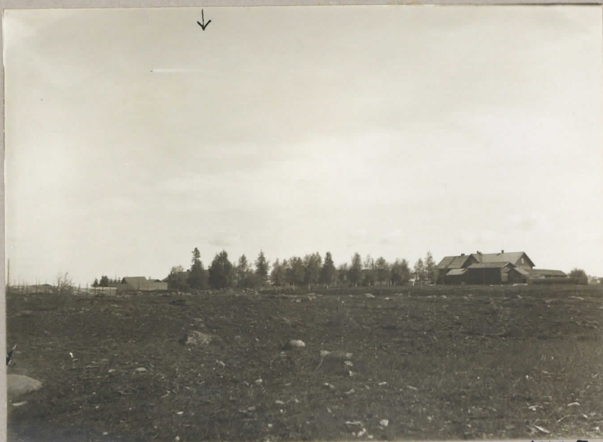
7105. Pertunmaa, Kuusela. Hauta ↓ kohdalla.