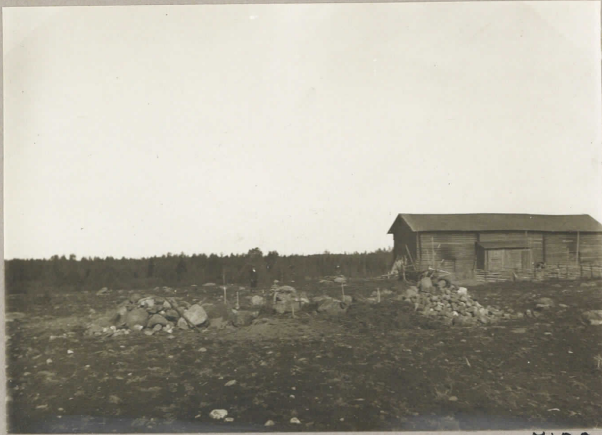
Perunmaa, Kuusela. Kaivon Tutki- minen aloitettu. Taustassa Kuuselan asuinrakennus.