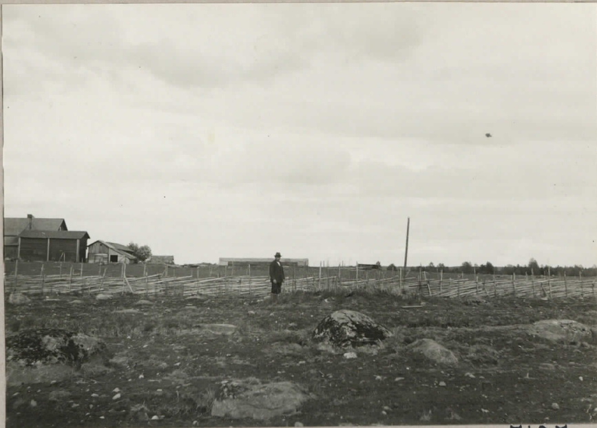
7107. Pertunmaa, Kuusela V. 1929 tutkittu hauta. Haudon kohdalla maam. Fabian Kauppi.