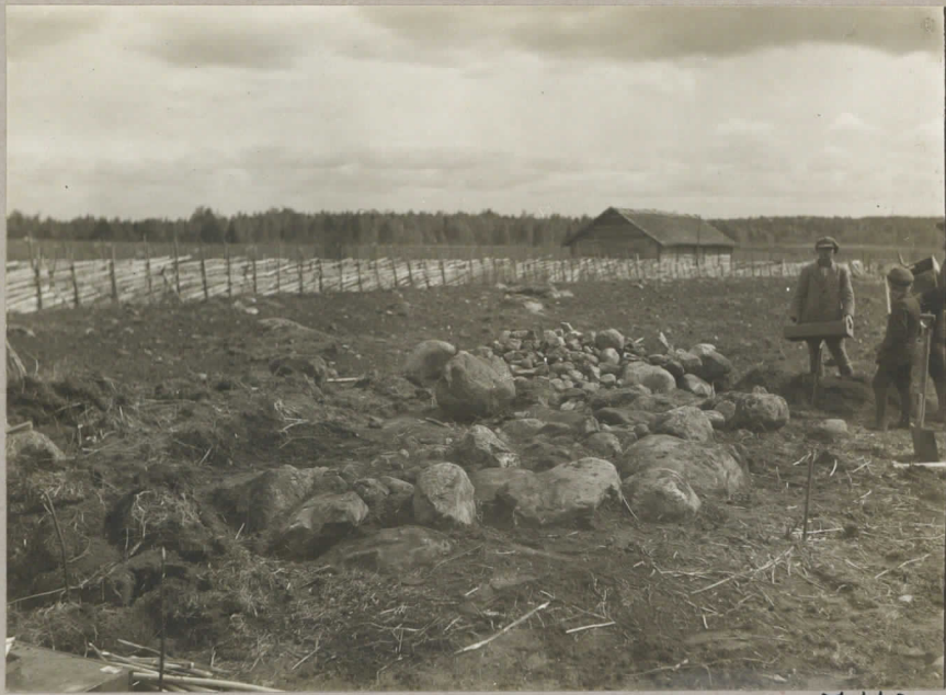
7110. Hausta rajastettiin.