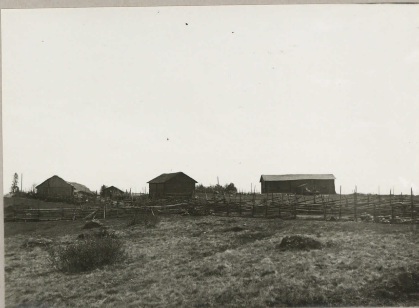
7106. Pertunmaa, Kuusela. Hauta oikean puo- lisen riikien Takana. Kuva NW-suunnasta.