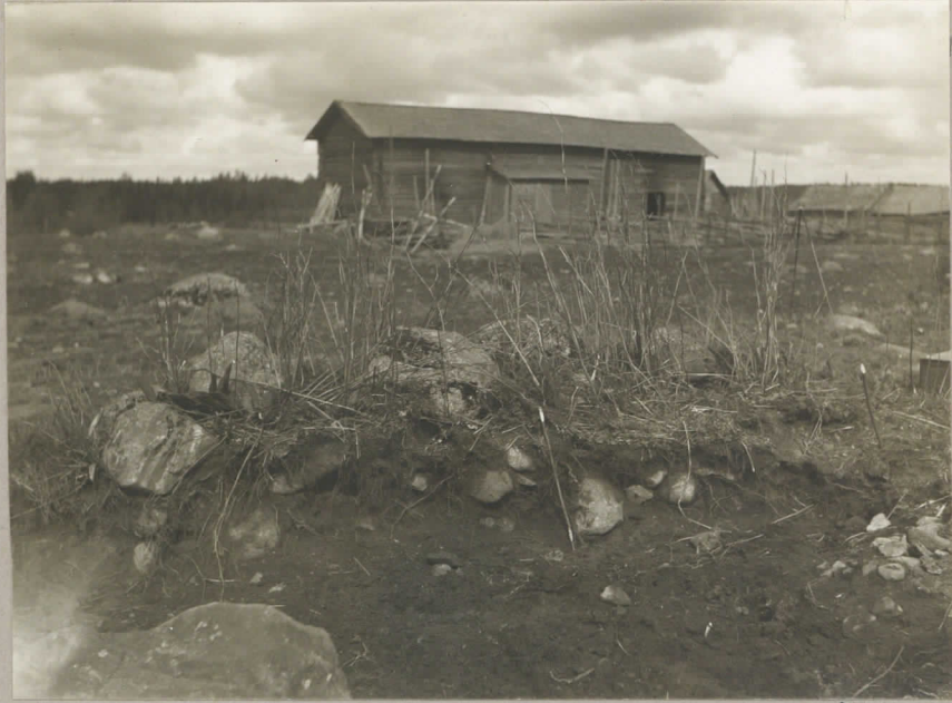
Perttunan, Kuusela 7111. Poikkileikkauksen haudasta, ennen kair- vausta.