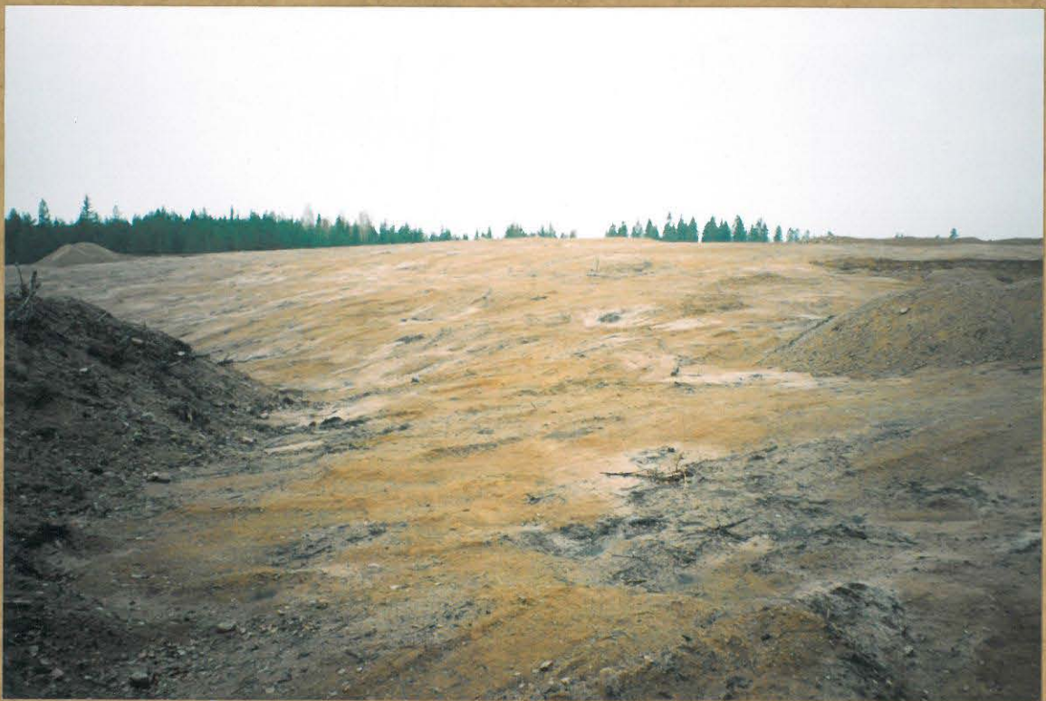
KIVIKAUTINEN ASUINPAIKKA-ALUE PUSKUTRAKTORIN JÄLJILTÄ, ETUALALLA OIKEALLA ASUMUSPAINANNE NÄKYY TUMMEMPANA (ALKUPERÄISTÄ MAANPINTAA), HUOMAA HUUHTOUTUNEEN HIEKAN ALUEET! KUVATTU OSAPUULLEEN IDÄSTÄ HIEKKAVALUN PÄÄLTÄ.