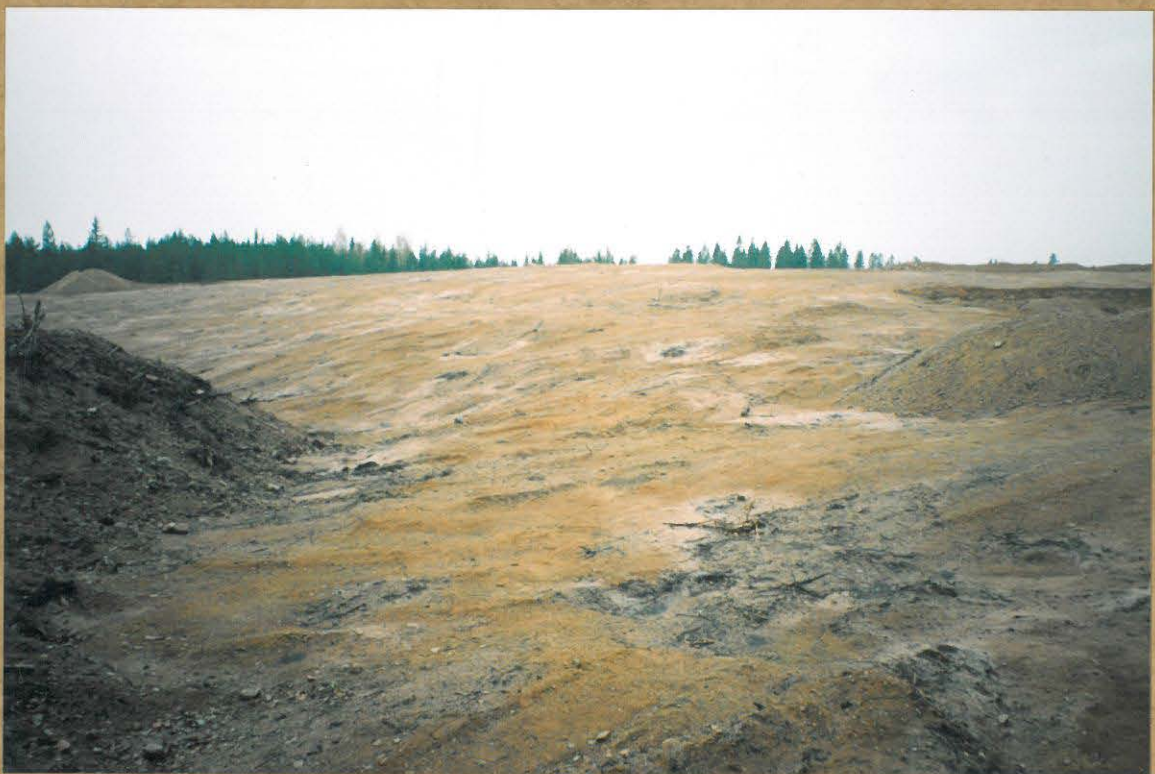
KIVIKAUTINEN ASUINPAIKKA-ALUE PUSKUTRAKTORIN JÄLJILTÄ, ETUALALLA OIKEALLA ASUMOSPAINANNE NÄKYY TUMMEHANA (ALKUPERÄISTÄ MAANPINTAA), HUOMAA HUUHTOUTUNEEN HIEKAN ALUEET! KUVATTU OSAPUILLEEN IDÄSTÄ HIEKKAVALUN PÄÄLTÄ.