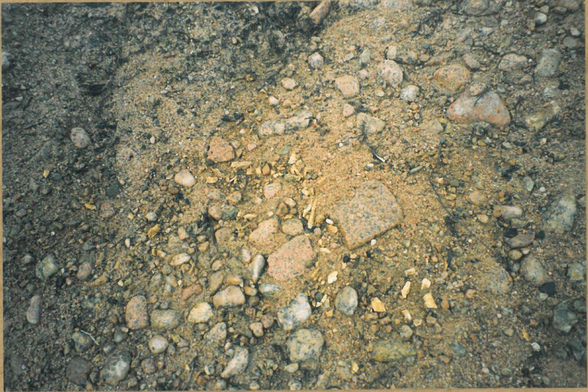
PALANEEN LUUN KESKITTYMÄ HARJUN KESKIVAIHEILLA. KUVATTU ETELÄSTÄ.