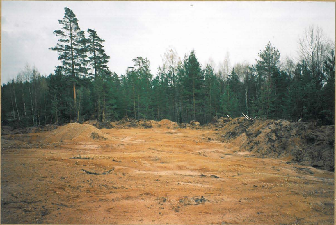
KIVIKAUTINEN ASUINPAIKKA-ALUE PUSKUTRAKTORIN JÄLJILTÄ, ASUMUSPAINANTEET ERÖTTUVÄT VIELÄ LAAKEINA SYVENNYKSIINÄ. KUVATTU OSAPUULLEEN LÄNNESTÄ.