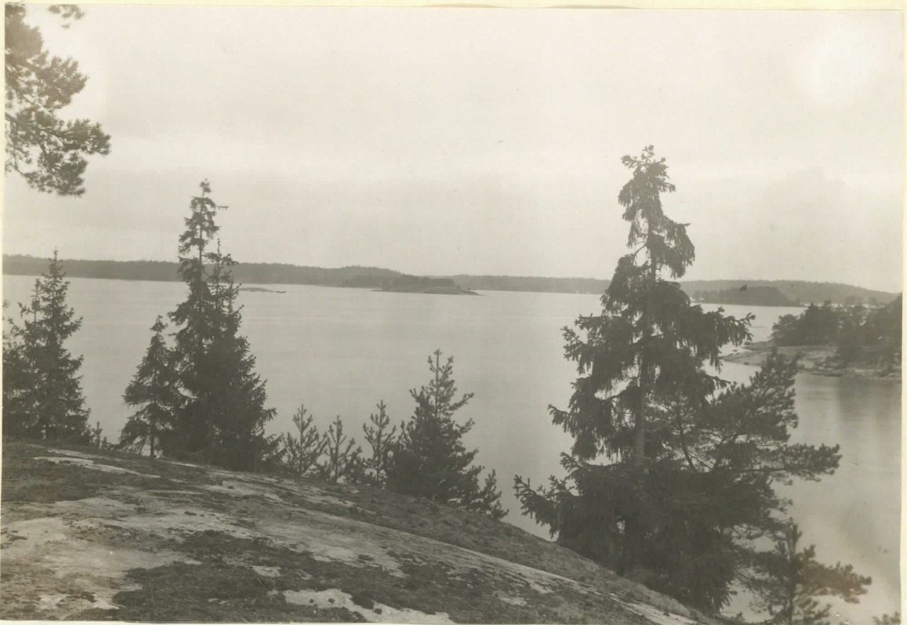
Parvom pidiäjä, Svartbäckens kyrka, Kaitö. Lev. 6627. Kuva 3. Näköala Kuvama 2. mäkyriellä kallialta jokseenkin lounaaseen yli Svartbäcksfjärdenin Kall. Sköldvikeniä. 1. X. 1927.