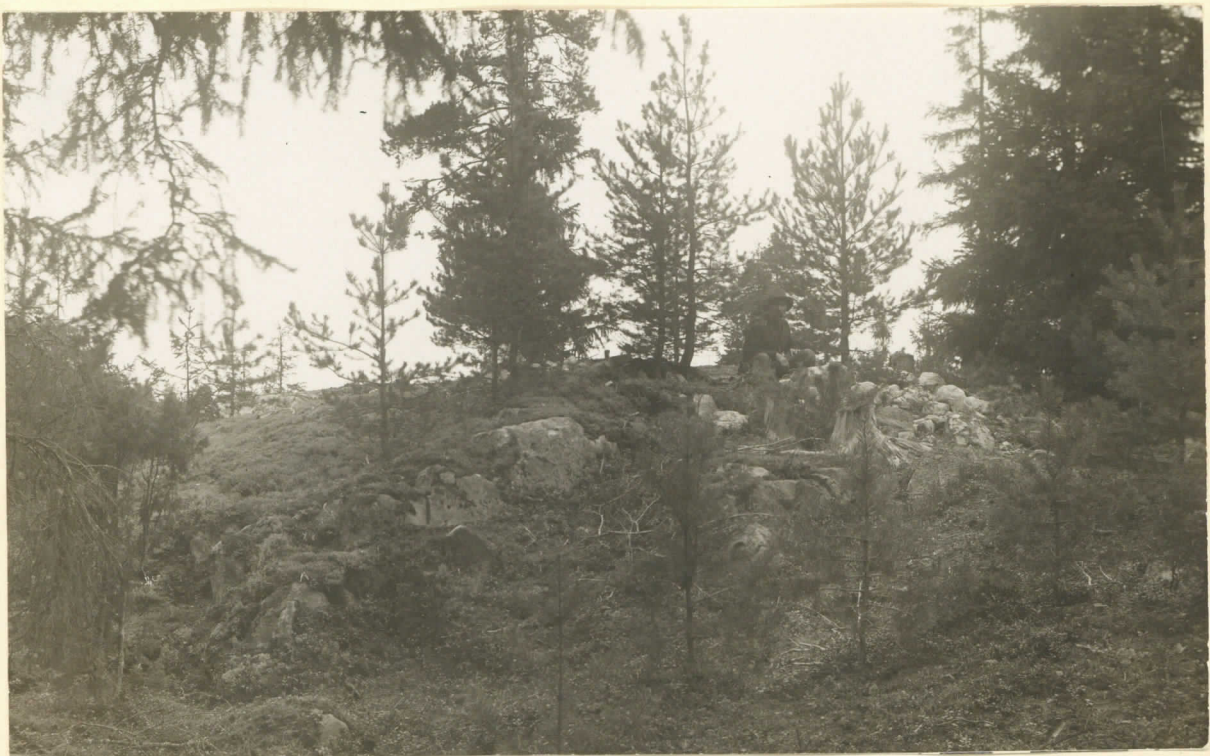
Kuva 2. Porvoo jätäjä, Svartsån Kyla, Koito. lev. 6626 Läntinen pergattu haunhaunio (Kallion kulleessa oikealla, sänä nimä onnistuu), josta keihäänkärki 8827 on löyd, etelästä päivi valokuvattuina. A. Europaeus I. X. 1927.