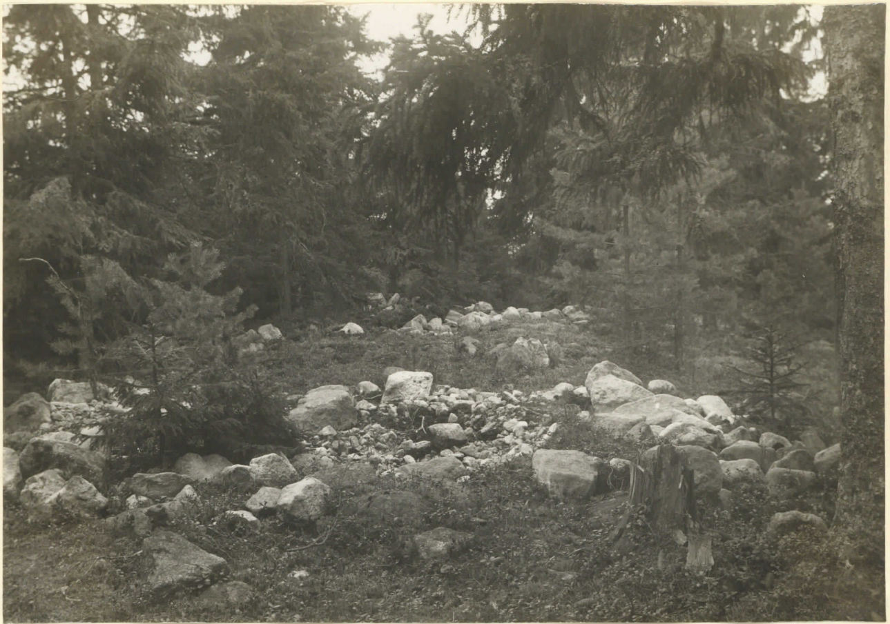
Kuva 1. Porvoo jätäjä, Svartsån Kyla, Koito. lev. 6625 Häisemmät kaksi hautausmaata yskäjois Koillisesta kuvattuina. Etummaisesta pienestä haunista, joka on no- teenijuljalla, on löydetty rannerengas 8693, haunysana nä- kyä haunis on isompi ja selvempi, mutta bitä ei yengottacca löyd. mitään. A. Europaeus I. X. 1927.