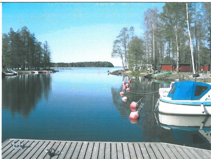
Kostianvirran suu laivalaiturilta idästä. Oikealla leirintäaluetta.