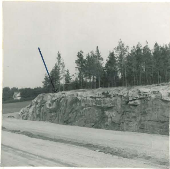
Esimeiden, 15435 KM 15454:1-4, löytöpaikka. Kuvan vasemmassa kulmassa Huuhkon talo. Etualalla Turku - Rauma tie- linja.