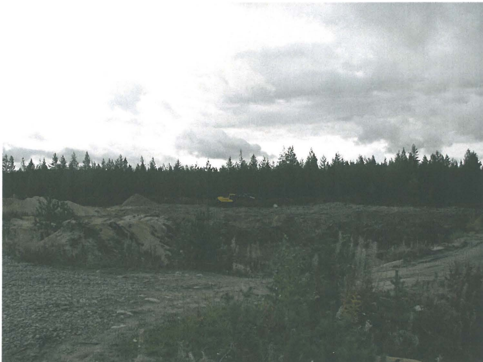
Laivalanhietikon uusi hiekkakuoppa tien länsipuolella.