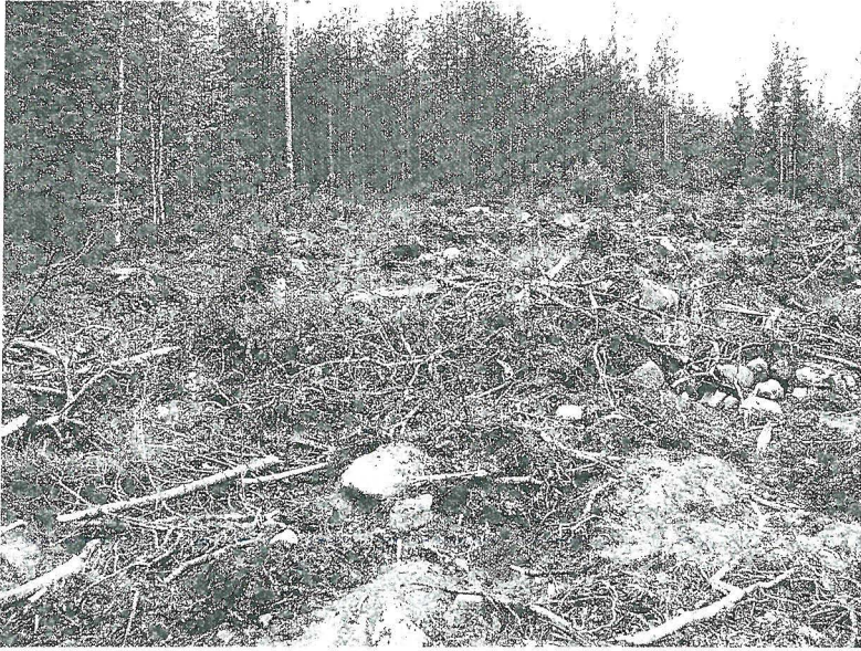
Hakkuujätteen peittämä äestetty röykkiö idästä