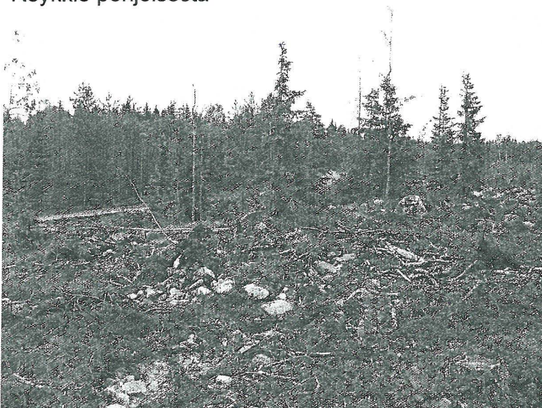
Röykkiö lännestä, Taustalla Pahkamaantie.