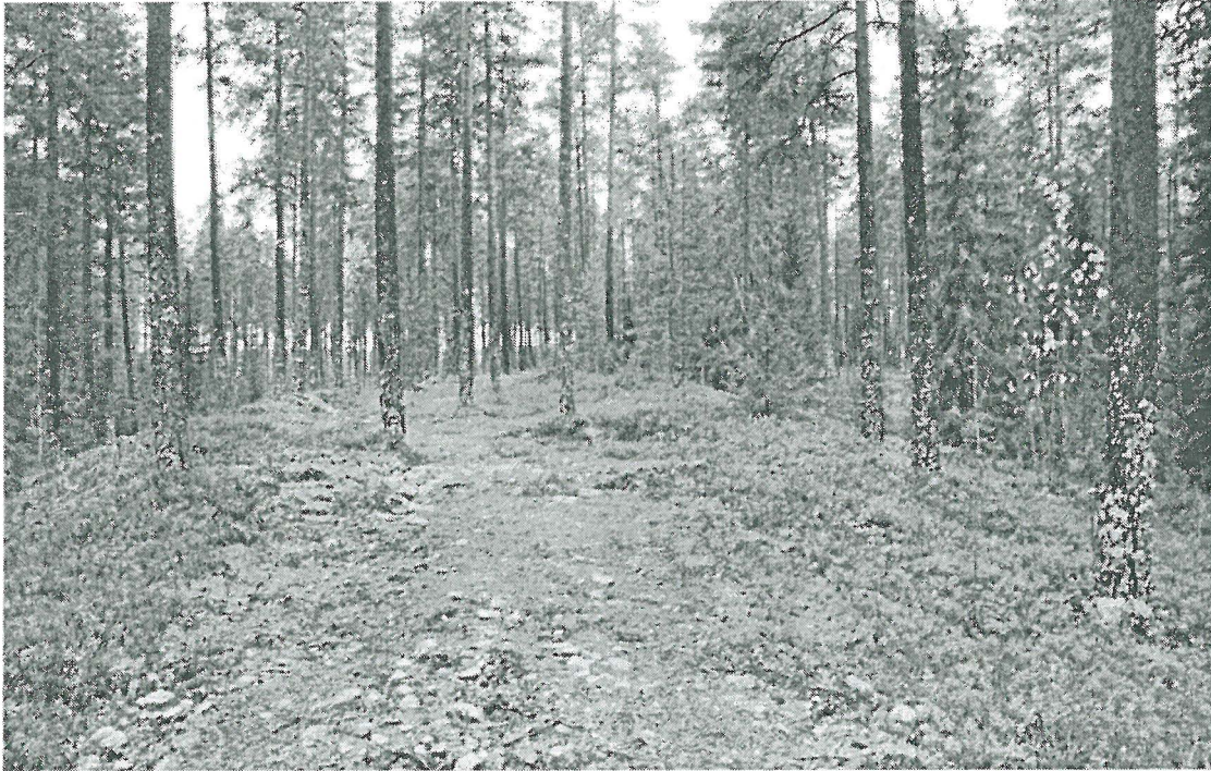
Kuva 5. Pohjoispääty ennallistettuna. (400)