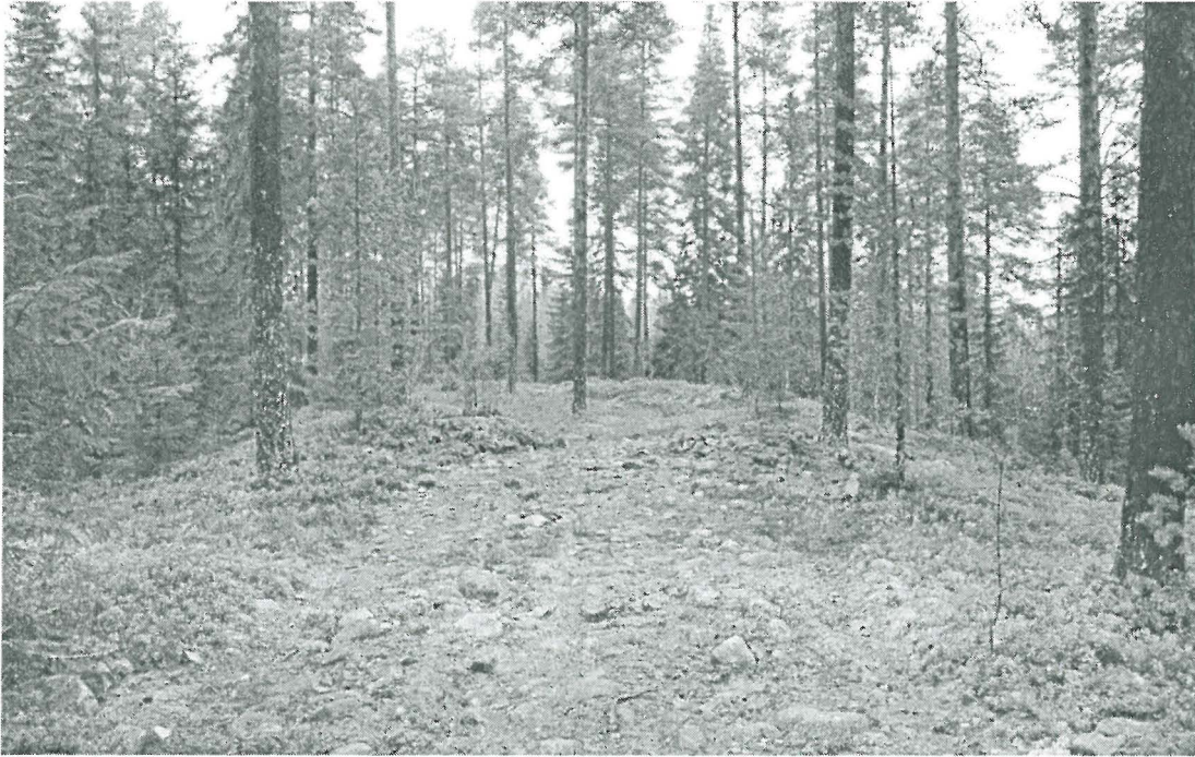
Kuva 7. Yleiskuva Pikku Jakenaron jätinkirkosta ennallistamisen jälkeen. (200)