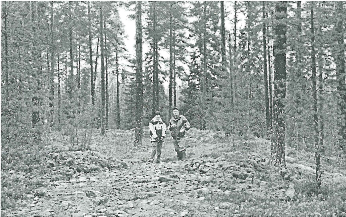
Kuva 4. Eteläpääty ennallistettuna. (200)