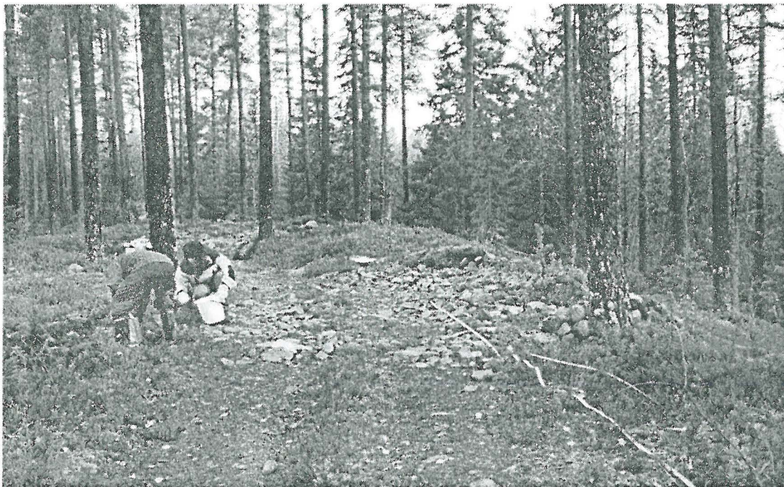
Kuva 2. Itäisen vallin keskiosan tuhot. Metsätien länsipuolelle siirrettyjä kiviä kerätään.(200)