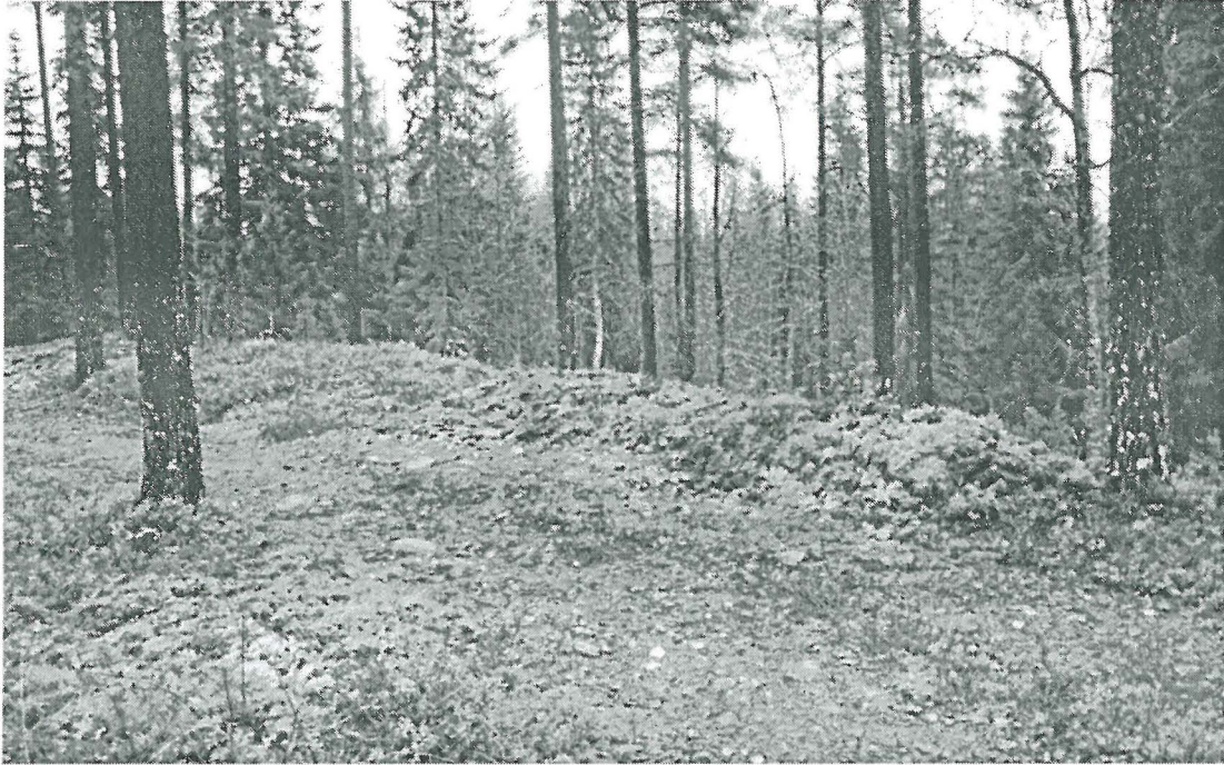
Kuva 3. Itäinen valli kokoamisen ja maisemoinnin jälkeen.