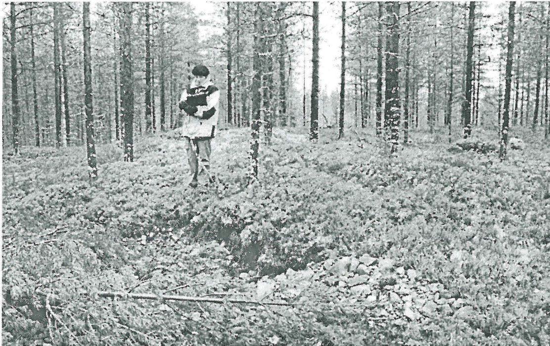
Kuva 6. Soranottokuoppa Jylhänharjun jätinkirkon vieressä.