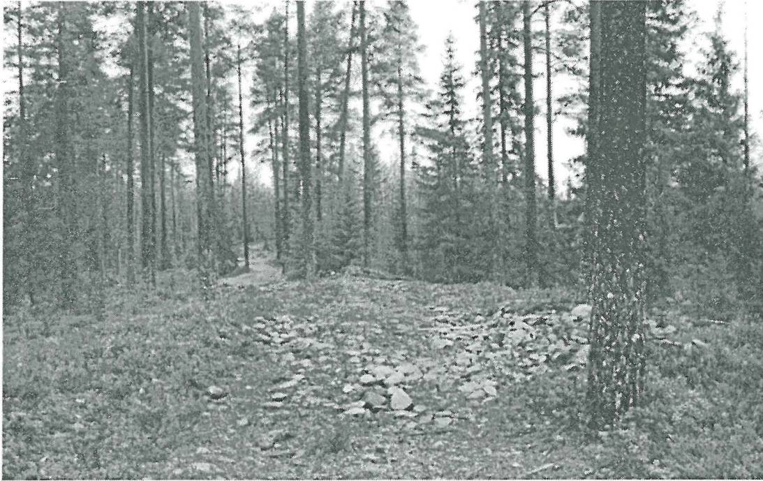
Kuva 1. Etualalla pohjoinen päätyvalli jätinkirkon sisästä kuvattuna. (400)