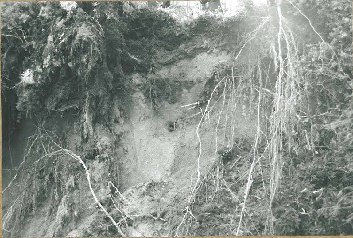
Hiekkakuopan reunassa osittain tuhoutunut liesi.