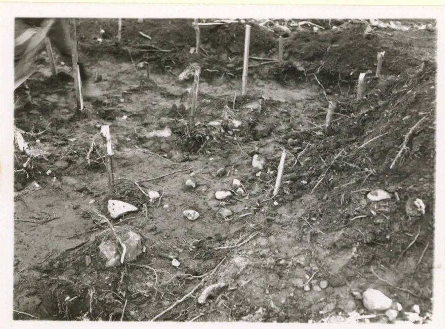
Kuva 4. Valok. V. Luho 1949