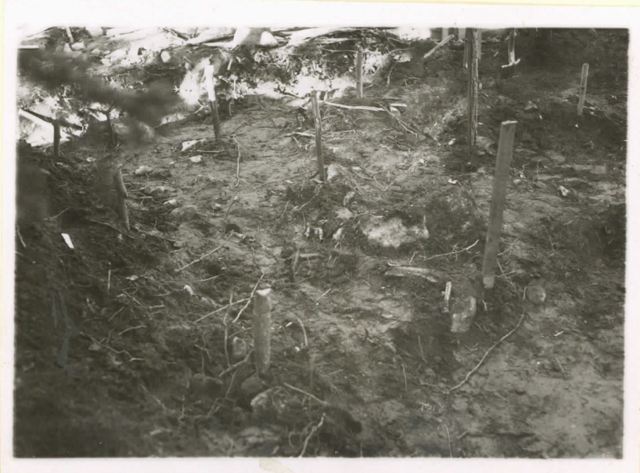
Kuva 5. 1949