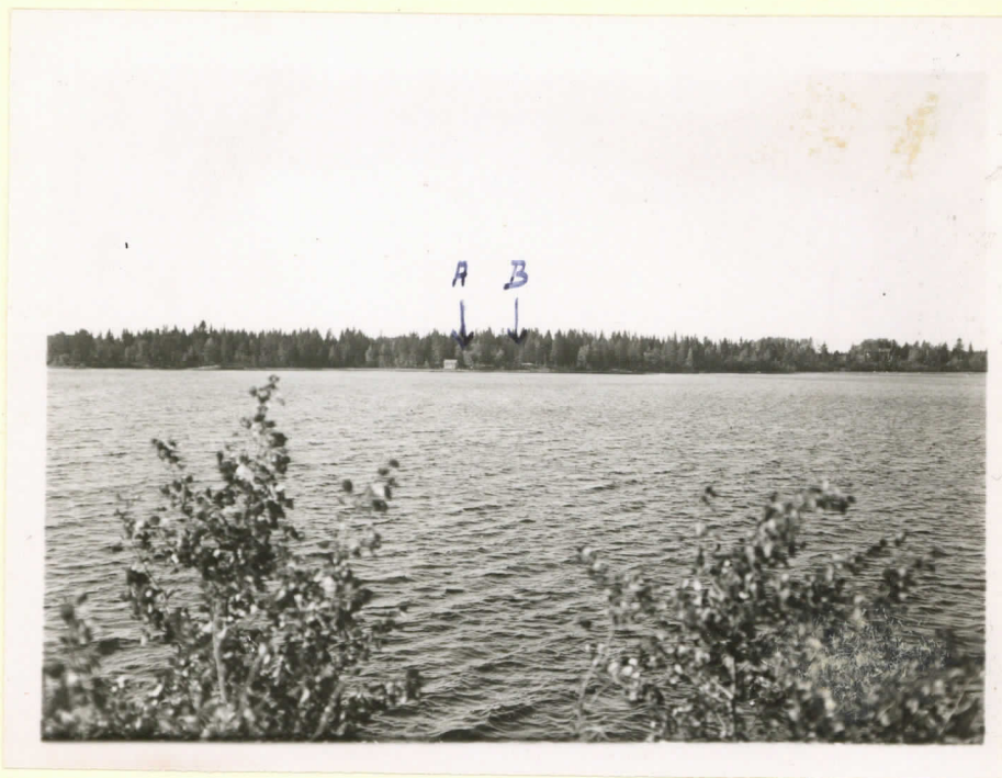
Kuva 2. Valok. V. Luho 1949

E. Suviselkdon löytämien kiviainesten KM12224:1-5 löytöpaikka (kuvasa näkyvän ison kiven ympäristö). - kuvan on Pyhäjärvi-seura lahjoittanut kansallismuseolle. k.o. Löytöpaikka on n. 21 m pohjoisessa Suviselkdon rakenteilla olevasta huvitasta. - Esmat olivat olleet kalliojohdella, mikä näkyi kuvassaakin.