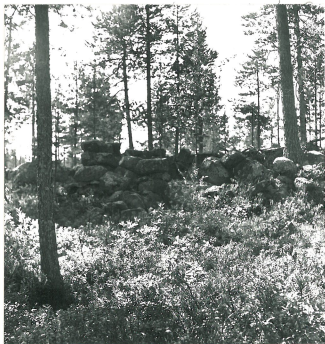
46050 TALONPOHJA 1. KOILLISESTA KU- VATTUNA.