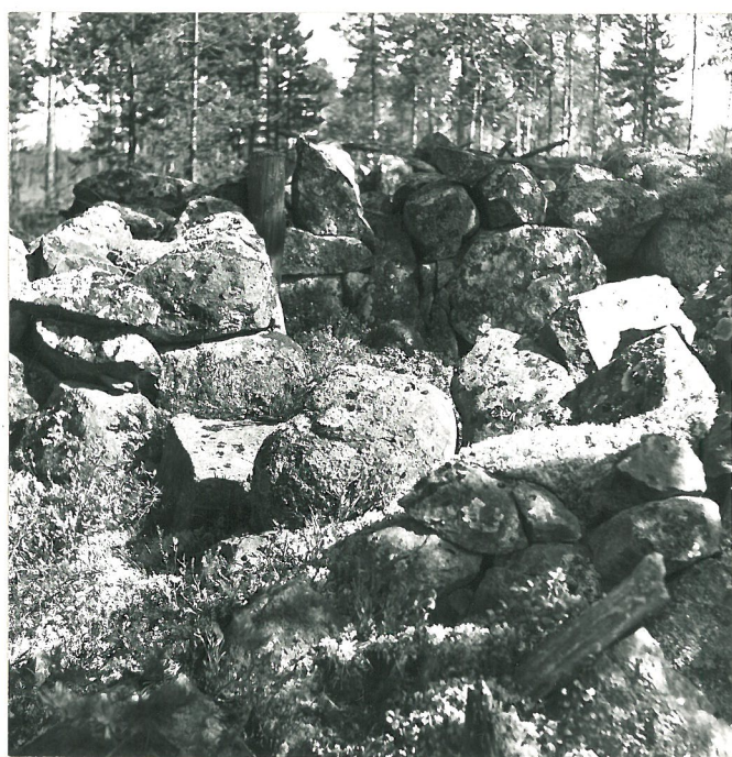
46057 TALONPOHJA 2:N OVI-AUKKO LÄNNESTÄ KUVATTUNA.