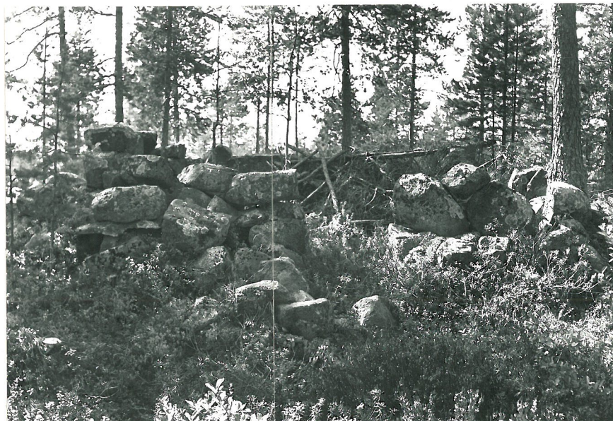
46048 46049 TALONPOHJA 1. KOILLISESTA KUVATTUNA.