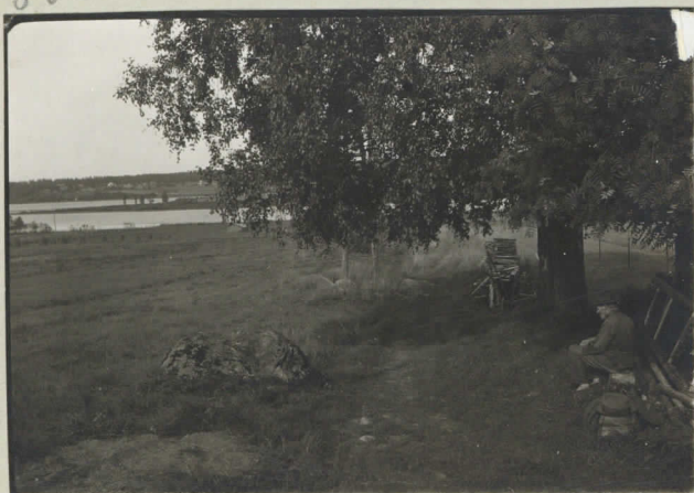
8. Uurikkini Ahtilan talon viressä. Takana Pintelet.