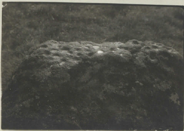
10. Ahtilan uurikkini.