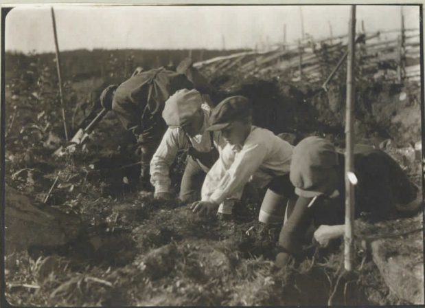
5. Kaivaus käynnissä.