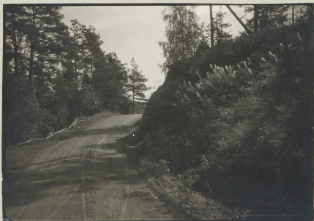
6. Märinkallio, Pälkäneen ja Hauhon rajalla, Koksos- tenjärven lähellä.