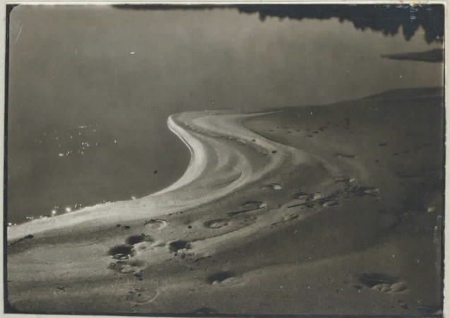
17. Ilmoilanselän ranta.