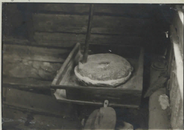
14. Ahtolan härjkinnet