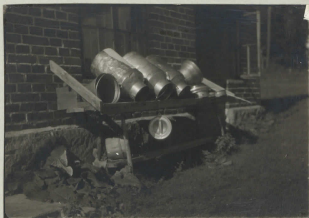
13. Rönkän maituastioita