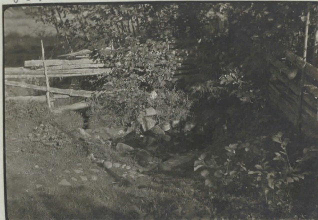
12. Uuaanmäen lähde.