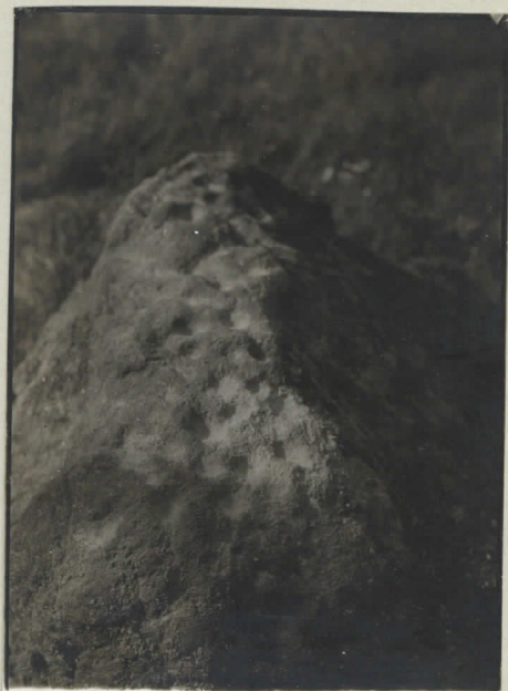
9. Ahtilan uurikkini.