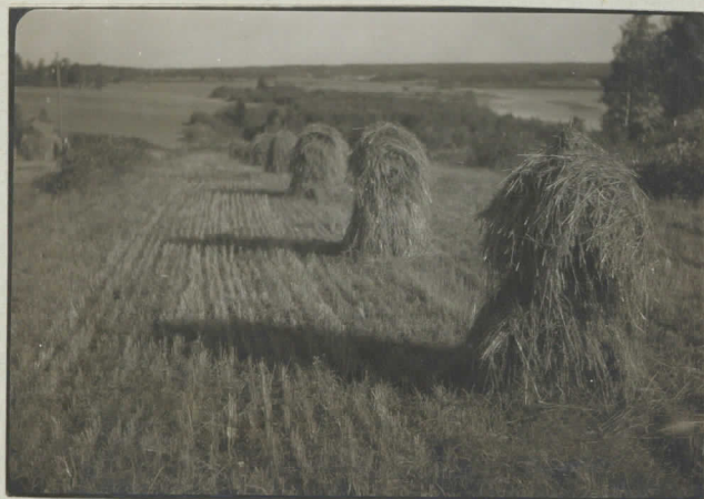
15. Kaurapeltto Korkosten, kärjen vieressä. Pitkeällä Ilmoilan selkää,