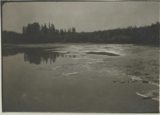
16. Ilmoilanselän ranta. Takana vasemmalla Kokkoetan kärki.