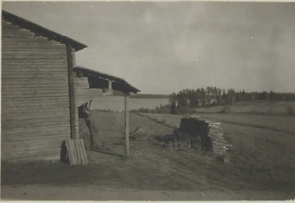
1. Kokkostonkärki takana oikealla, edessä Rönmin rühi.