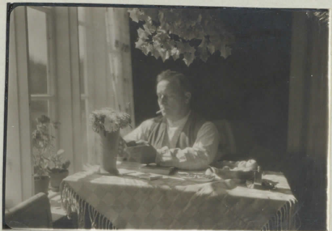
19. Rönin isäntä.