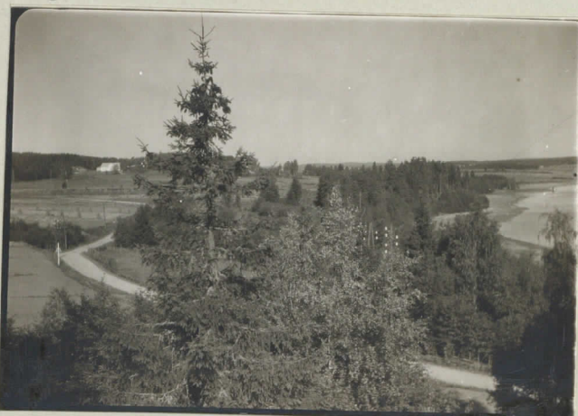
7. Näköala Märinkalliolta Laidikkalan kylään päin. Pitkällä Ilmoitankalle ja Koks- kosjärven läheisyydessä, takana Rönkä- valkoinen päärakennus.