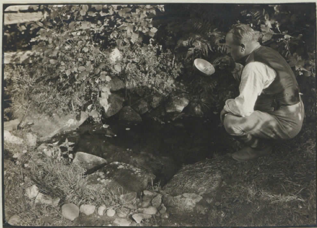
11. Uuaanmäen lähde. Pälkäneen laidikkalalla