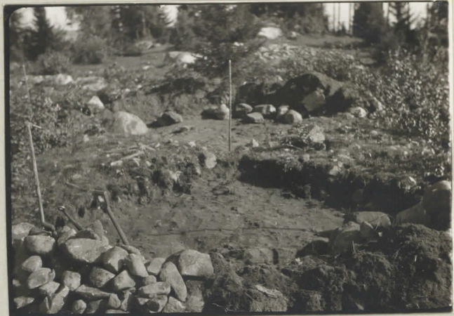
2. Kaivaus lounaasta kaksi ensimmäistä sektoria avattuina. Takana vasem- malla maakiven viressä punsas löytökohta.