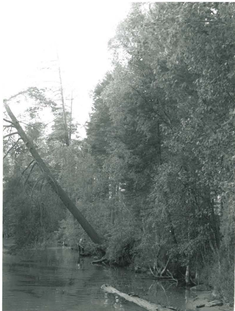
F.a. 3555 Rautalampi, Hanhitaival, Teronmaa 7:27 Kvartsit löytyivät törmän juurelta ja rantavedestä.