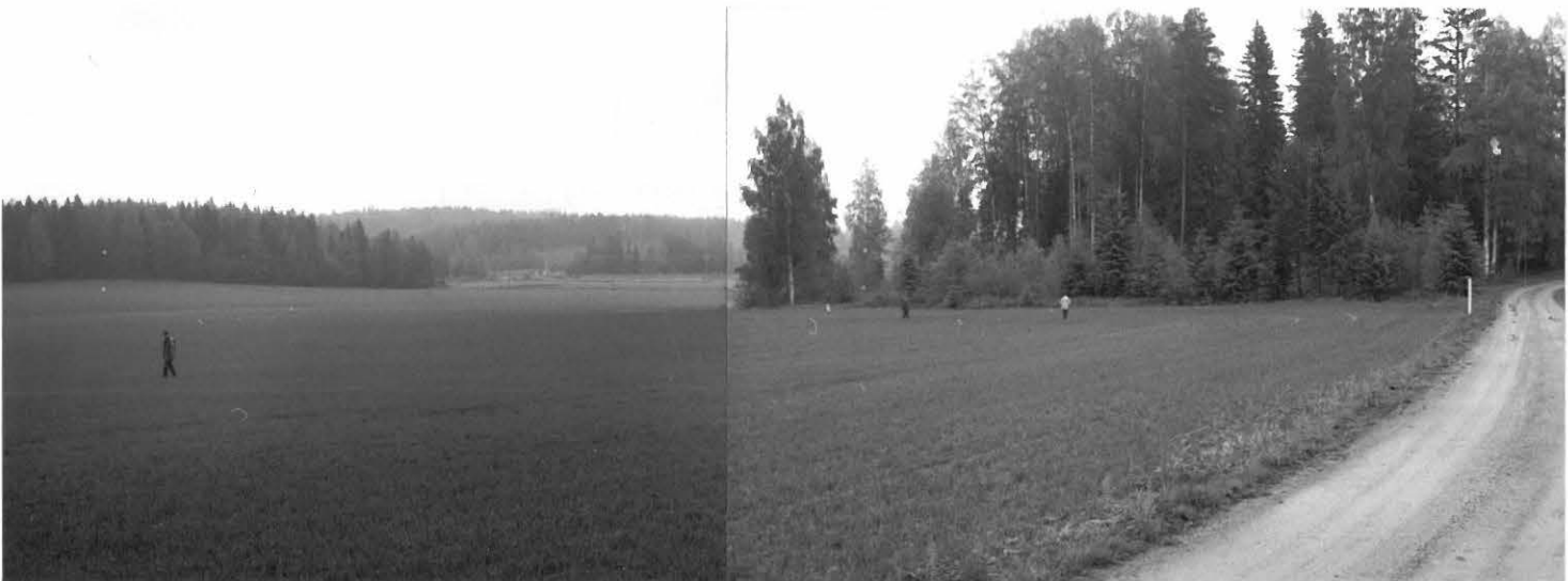
Kuva 2. Toivolan uusi asuinpaikka pellolla, panoraama (1/2). SW-NE. (f. 127238-127238)