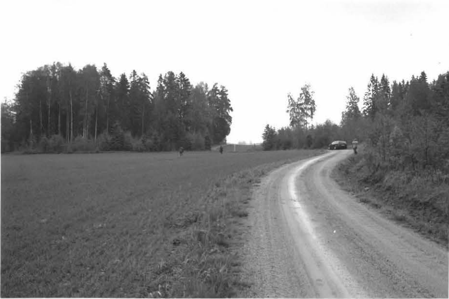
Kuva 1. Toivolan uusi asuinpaikka pellolla. W-E. (f. 127237)