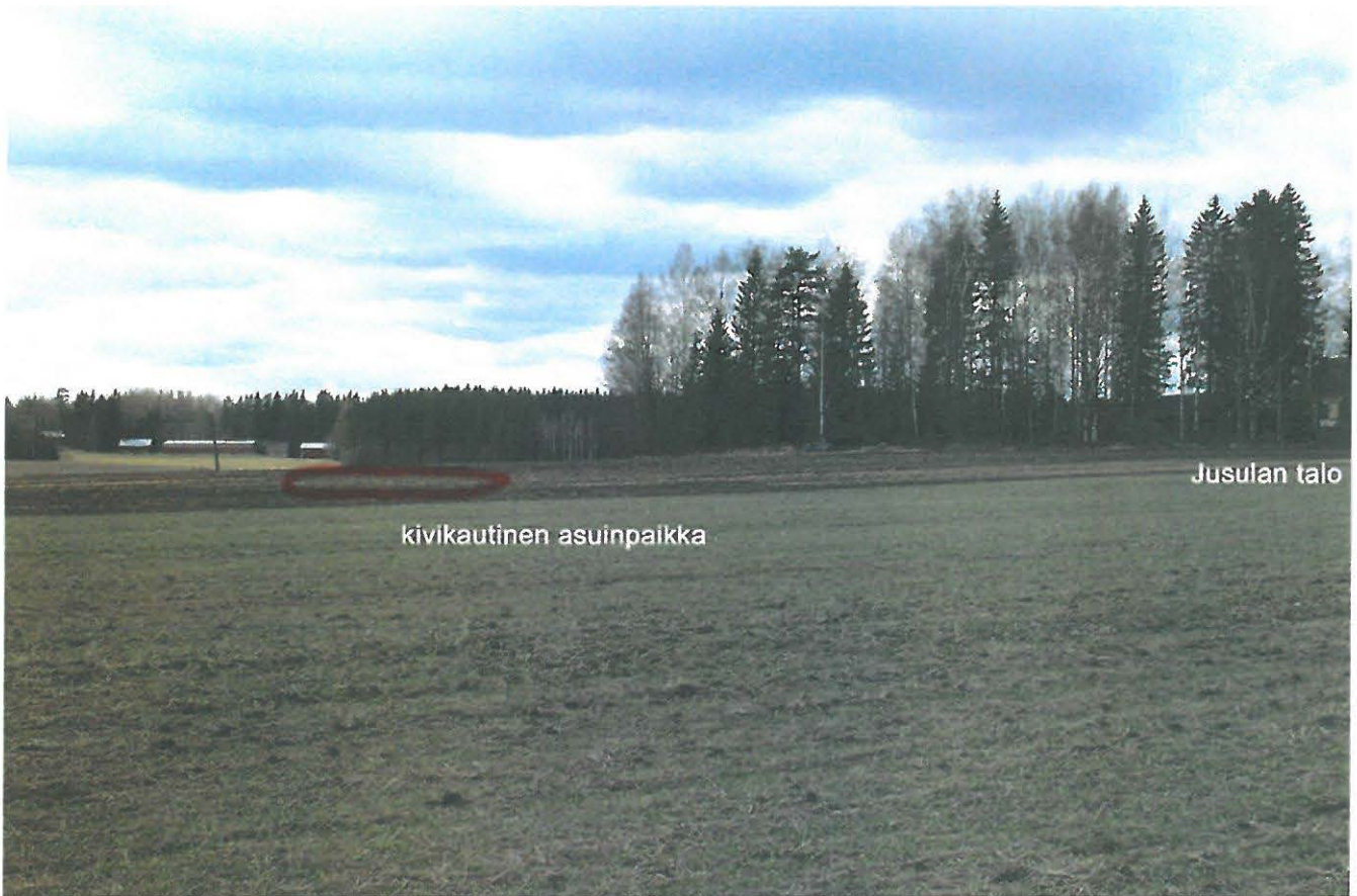
Kuva 1. Kivikautinen asuinpaikka hiekkaisella rantaterassilla Jusulan talon eteläpuolella. Asuinpaikan takana Vantaanjoen uoma. Kuvattu länsilounaaseen. JKR.