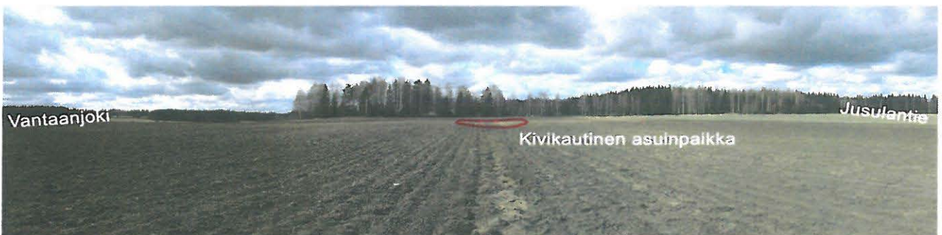
Kuva 2. Panoraama Jusulan eteläpuoleiselta pellolta. Vantaanjoen uoma vasemmalla, kivikautinen asuinpaikka Jusulan talon edustalla kuvan keskellä hiekkaisella törmällä, oikealla Jusulantie. Kuvattu luoteeseen. JKR.