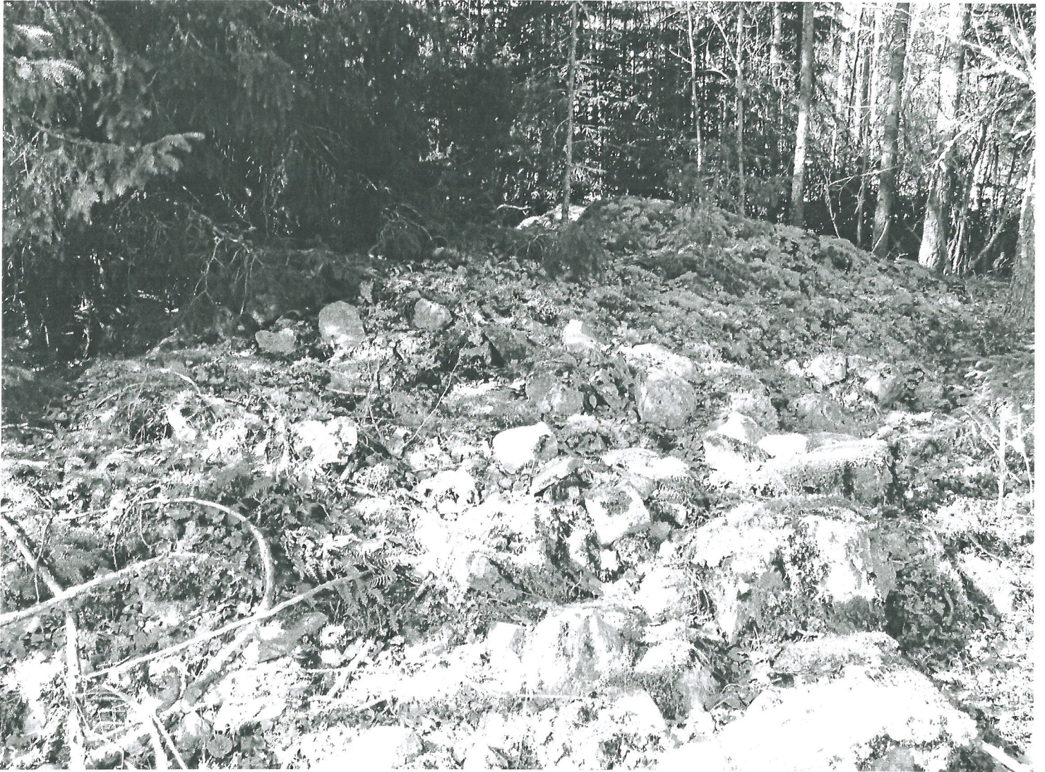
Röngelintä 1 kuvattuna itäkaakosta.