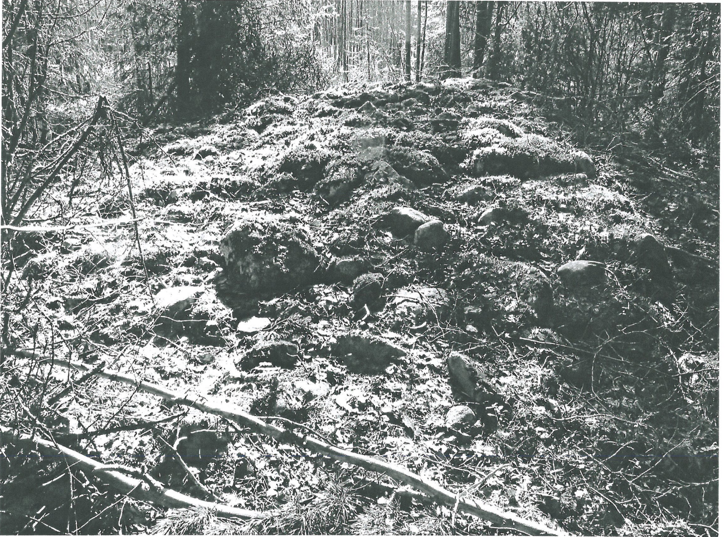
Kyläliö 2 kuvattuna luoteesta.