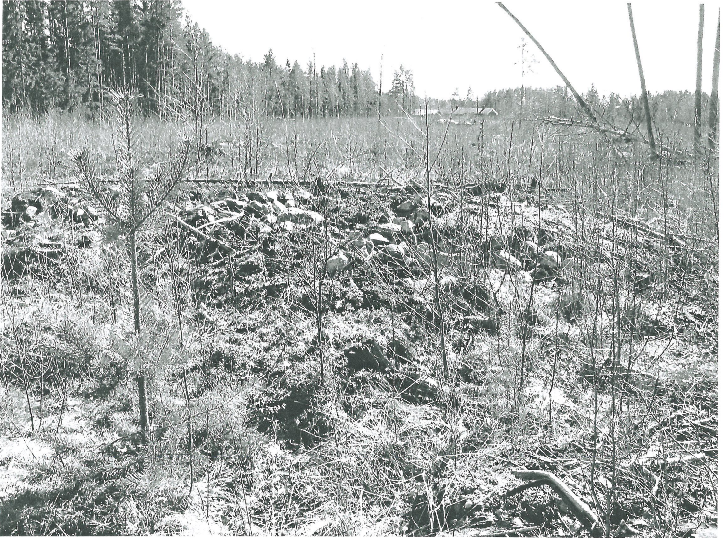
Pahoin tuhoutunut röykkiö 4 kuvattuna luoteesta.