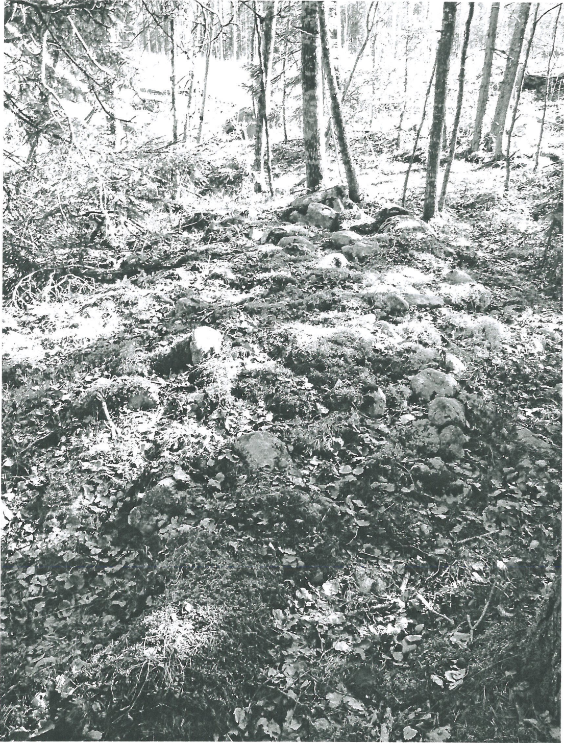
Köylälinen 1 vieräinen kivitys kuvattuna länsi- luoteesta.