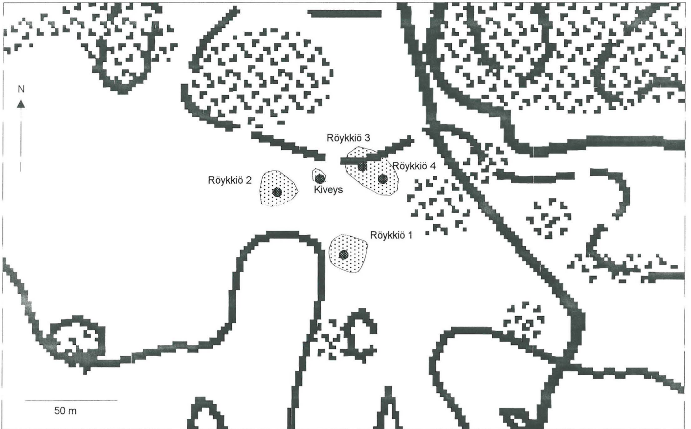
Mittakaava 1 : 2000, Peruskartta 20M1B3 (ykj) Muinaisjäännökset merkitty keskikoordinaattien mukaisesti pisteellä ja ehdotus suoja-alueeksi pisterasterilla.