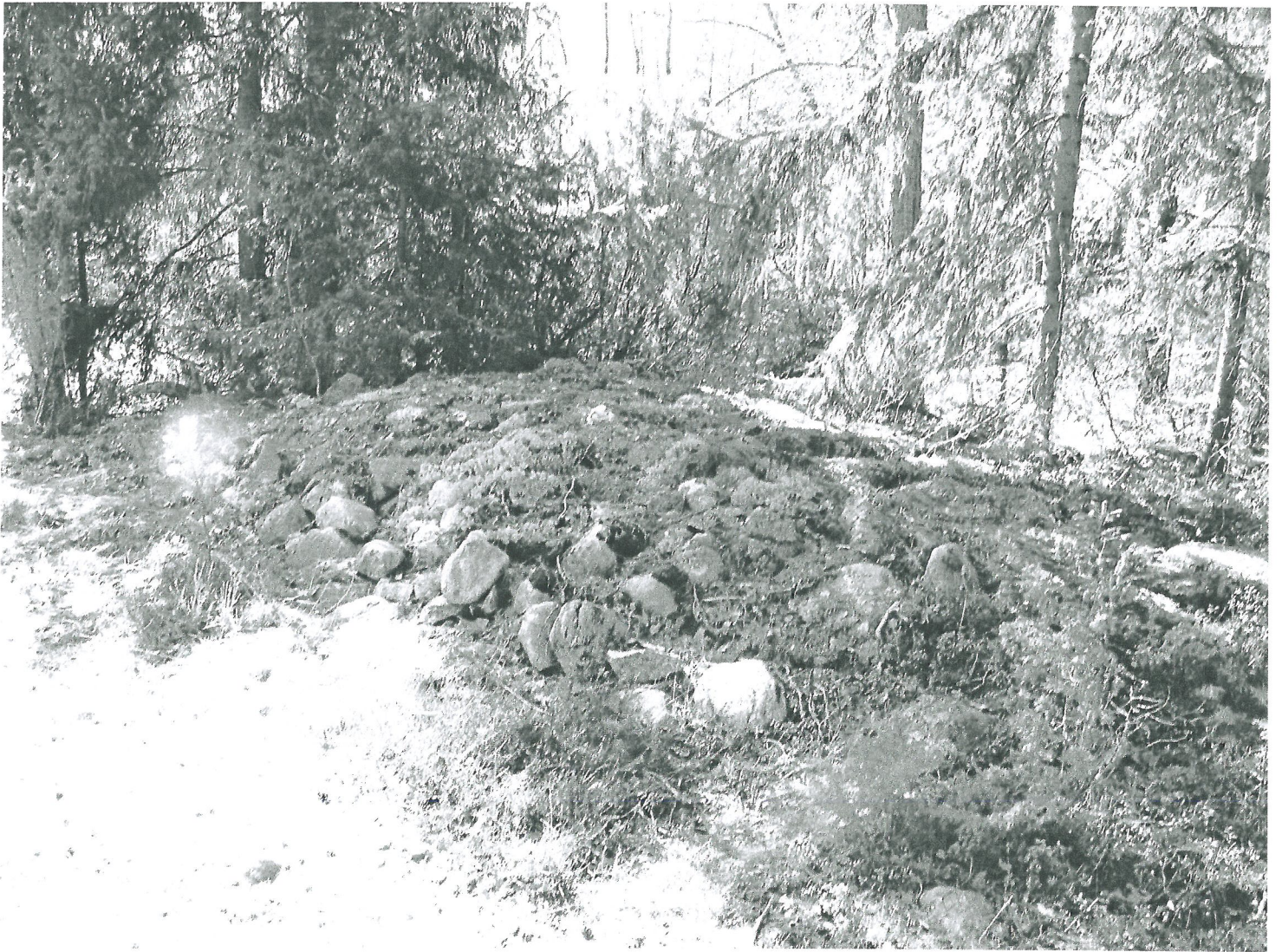
Röngeläis 3 kuvattuna koillisesta. Metsätie kuvan vasemmossa reunassa.