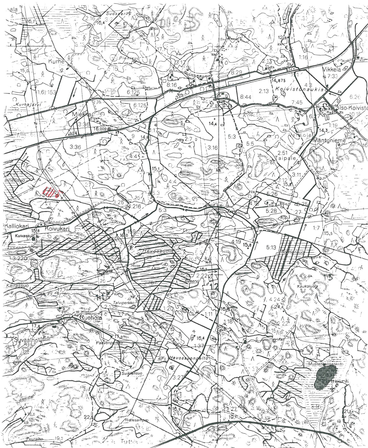
ote peruskarttatalehdestä 1132 11 Eurajoki (1985)