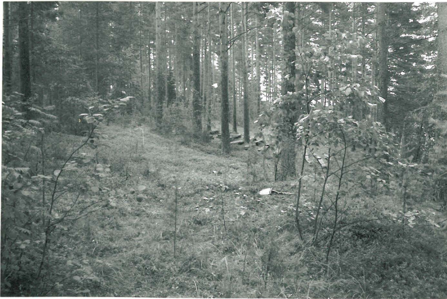
Kuva 2. Alemman tasanteen asuinpaikka. W-E. (f. 132428)