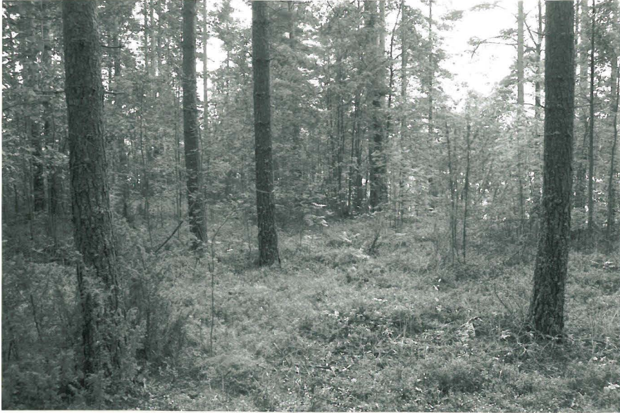
Kuva 1. Koekuoppa, josta J. Aroalhon löytämät luut sinisellä nauhalla merkityn puun luona. N-S. (f. 132427)