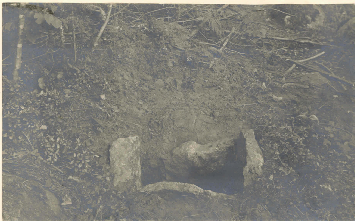
Kuva 2. Muinaisjäännös NW= suunnasta katsottu (vt. karttaan).