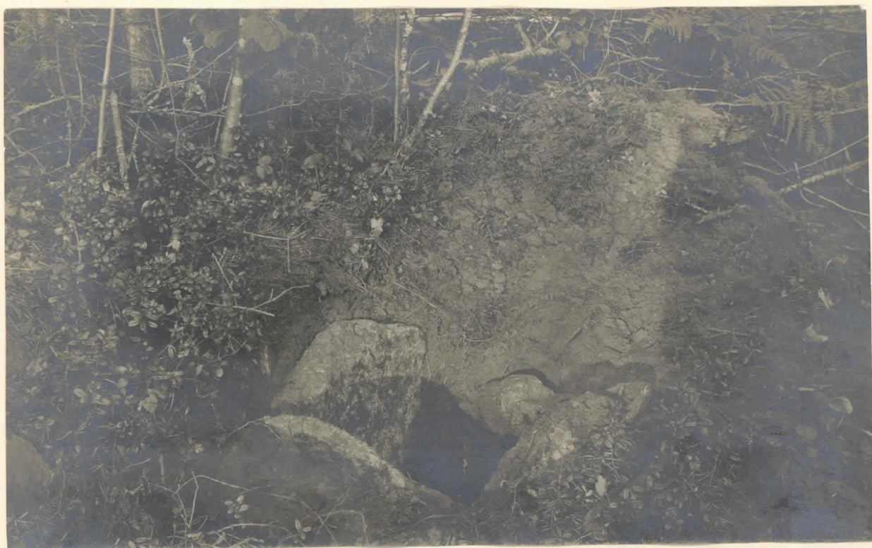
Kuva 1. Muinaisjäännös WFW= suunnasta katsottu (vt. karttaan).