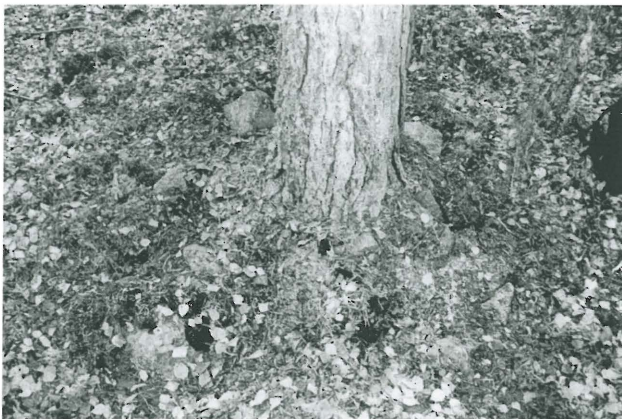
Yleiskuva kivilatomuksesta. NW