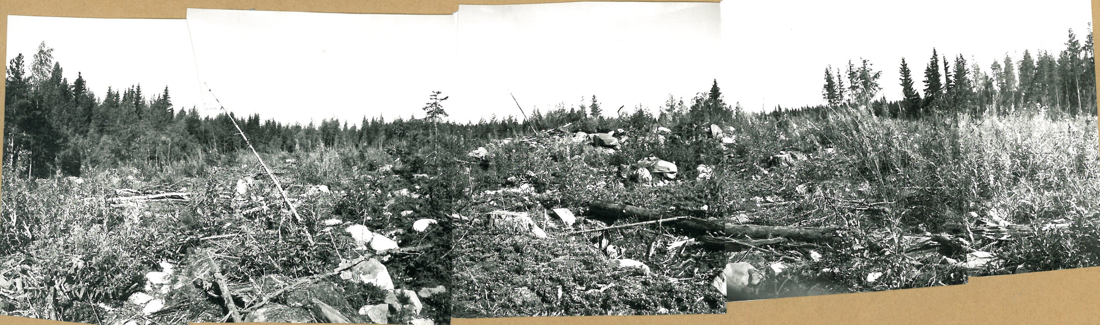
F 70515 - 70519 PANORAAMA: AJUNPAIKKA LÖYTÖJÄ KUKKULAN LAELTA. KUVATTU IDÄSTÄ.