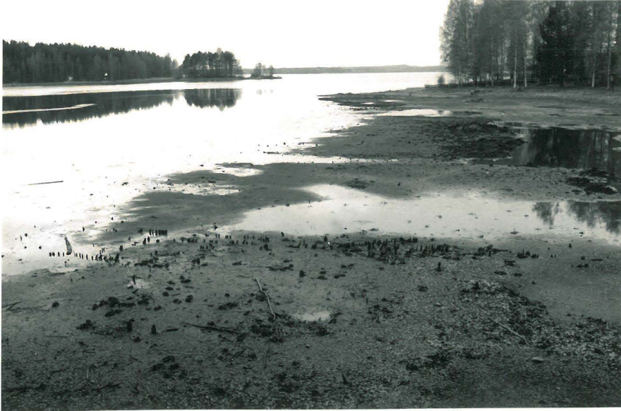
Kuva 1. Liistekatiskoja pohjamudassa. E- W.18.5.2003. (21160: 503).