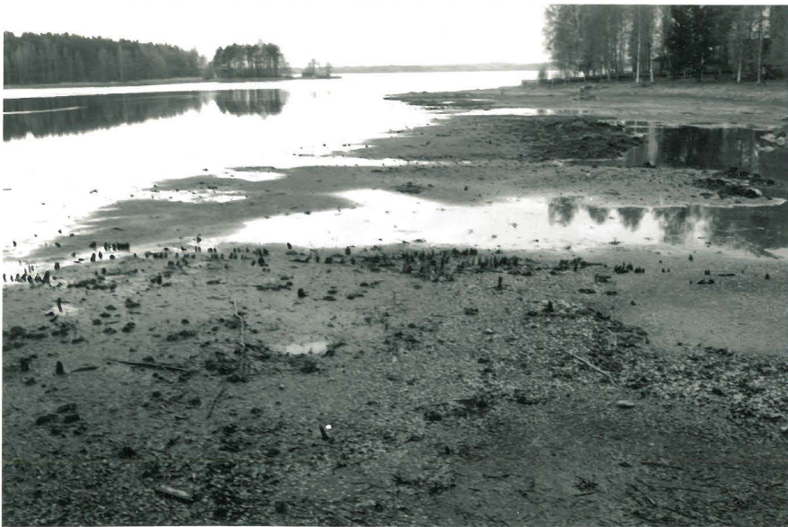
Kuva 2. Liistekatiskoja pohjamudassa. E- W.18.5.2003. (21160: 504).