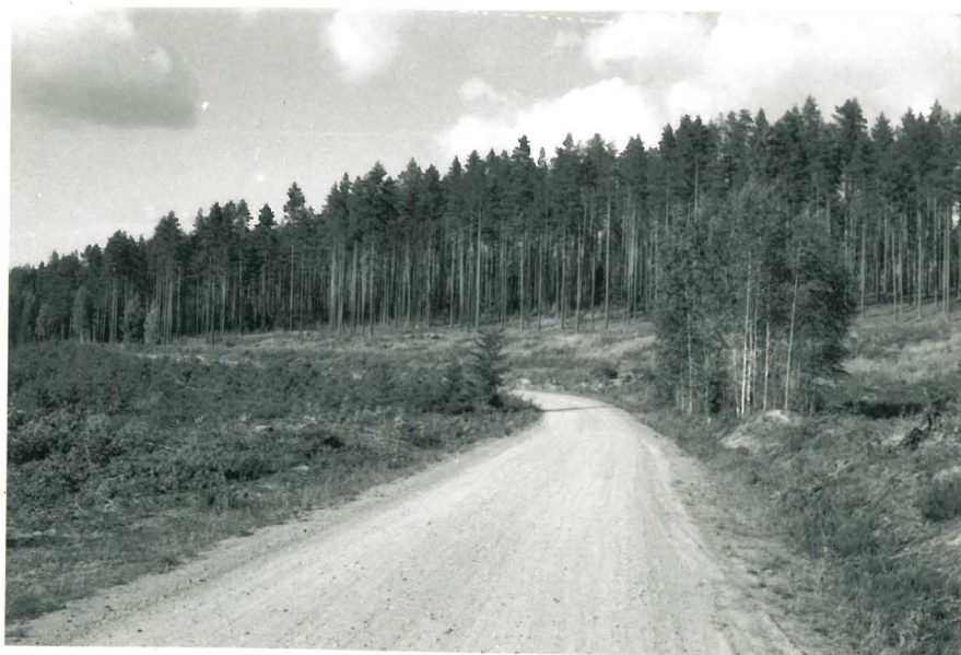
Multalan tien varsi, painanteet mutkan jälkeen törmällä, S-N. f. 125221.