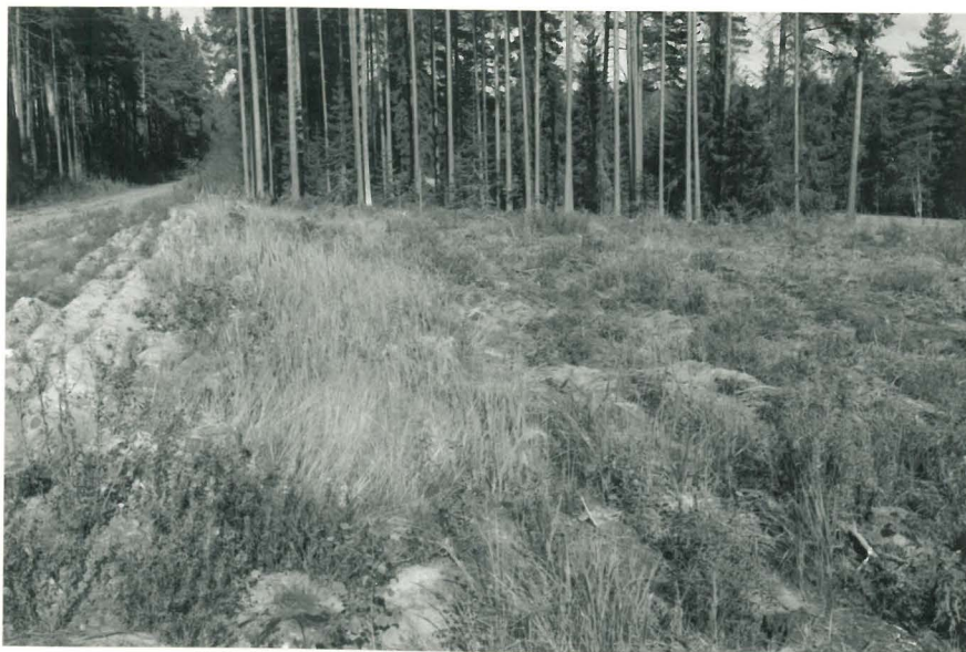
Aurattu painanne maantien varressa, S-N. f. 125217.