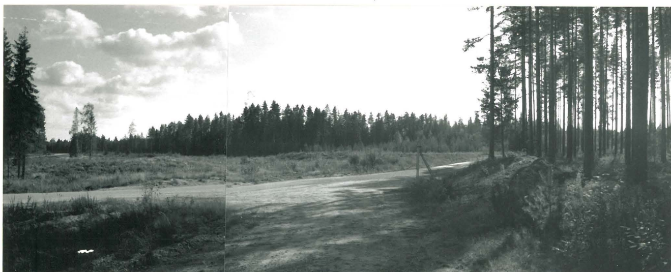
Metsäaureus Jaaman tien eteläpuolella, panoraama, N-S. f. 125219-125220.