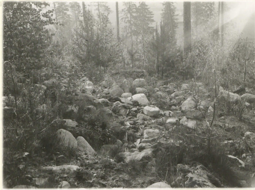
1. Röykkiö (suurimmaksi osaksi pengottu) 11012. ennen kaivautta N:stä päin.