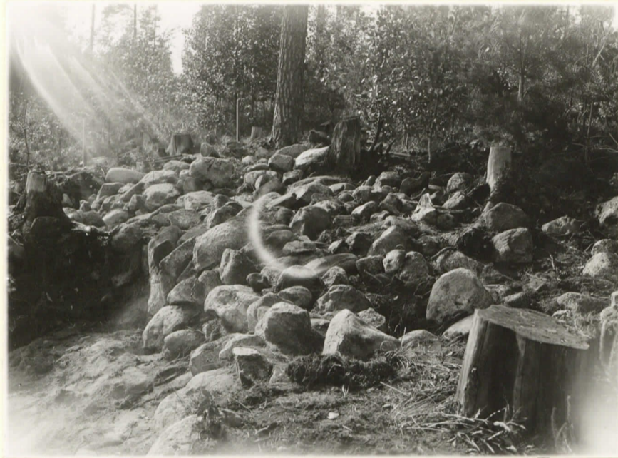
2. Röykkiön koskemattomampi, N-puo- leinen osa O:sta valokuvattuna 11013.