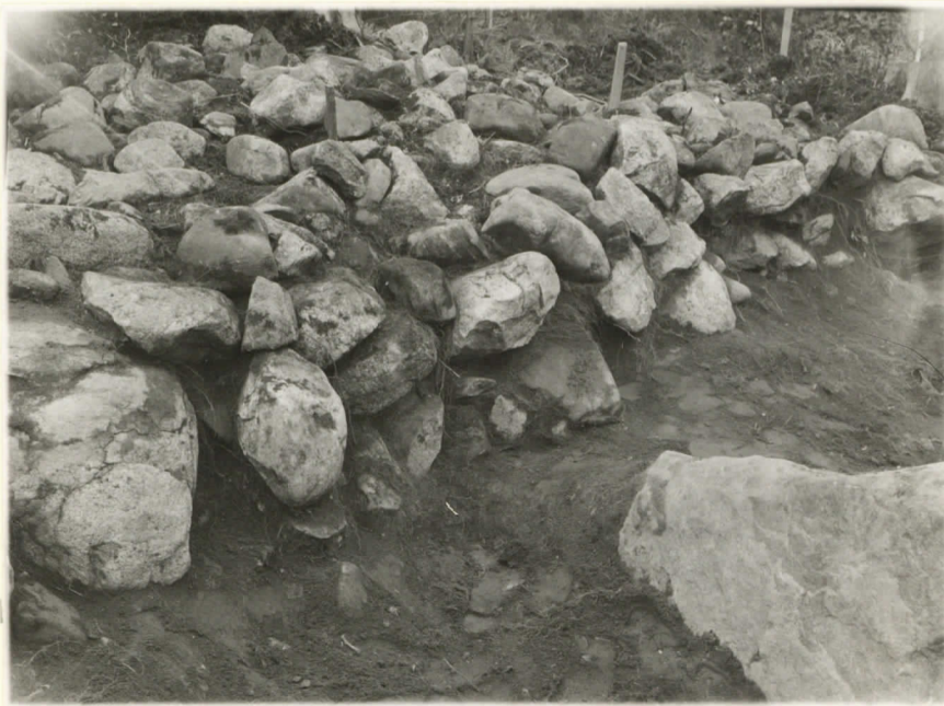
3. Röykkiön porkkileikkaus linjalla 11014. A-B. Kuva SW:stä päin.