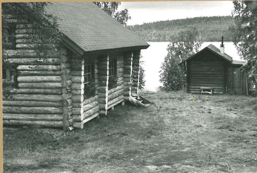
f. . Löytöpaikka lounaasta. Taustalla Pyhäjärvi. Kvartseja vasemmalla olevan asuinrakennuksen kohdalta pihamaasta.