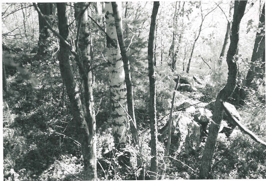
F 74082. Arveltu laiturin kiveys Lamposaaren etelärannalla.