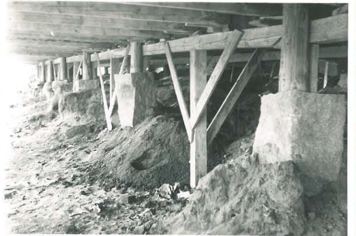
Rakennuksen alusta. Kaivaus suoritettiin oikealla lattian alla, missä paalut roottuvat vaaleina.