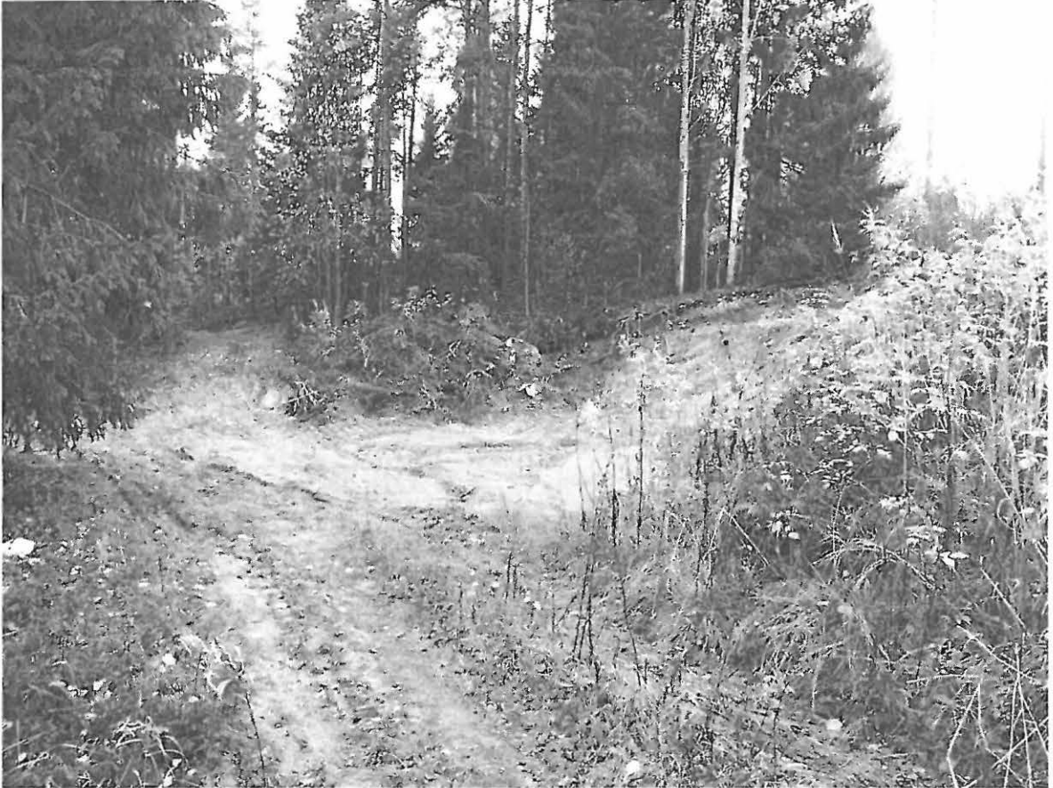
Kuva 1: Löytökohta on kuvassa vasemmalla keskellä - nousevalla polulla, kuvan risukan tasalla. Katsottuna kohti pohjoista, Jokilahteen (vasemmalle) johtava tie jää taustalle metsän taakse.