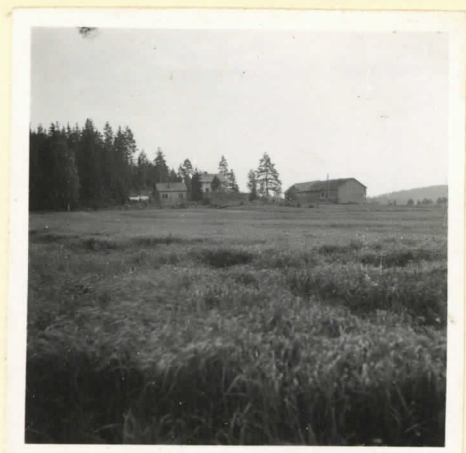
L. 17779. Kalmisto pää- rakennuksen edestä. Tupa otettu luoteesta käsini.