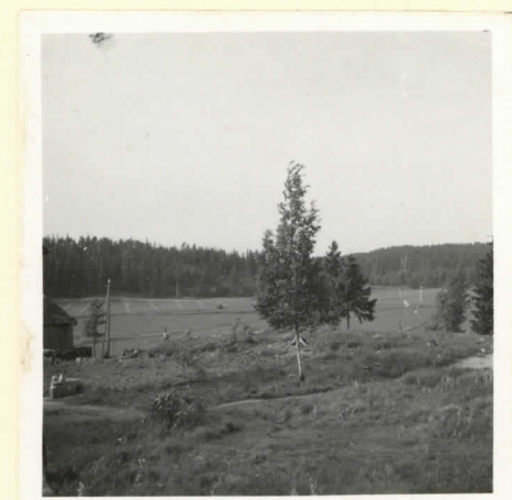
L. 17781. Kalmisto kumpu suunnilleen kaakosta käsini. Tupa talla maan- siv Lauosta Karunaan.