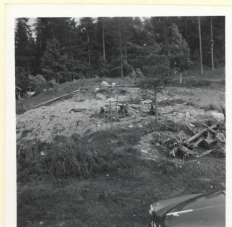
L. 17783. Kalmisto ennen häiräystä.