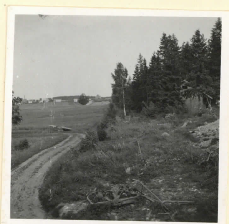
L. 17784. Tupa kalmiston luoteisreunasta Lauvon kirkolle päin.