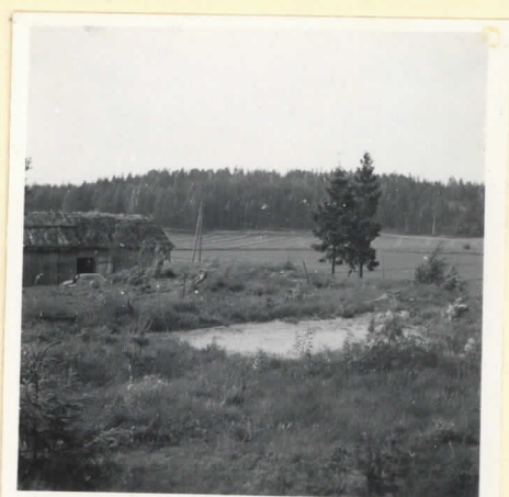
L. 17780. Kalmisto kumpu suunnilleen idästä käsini