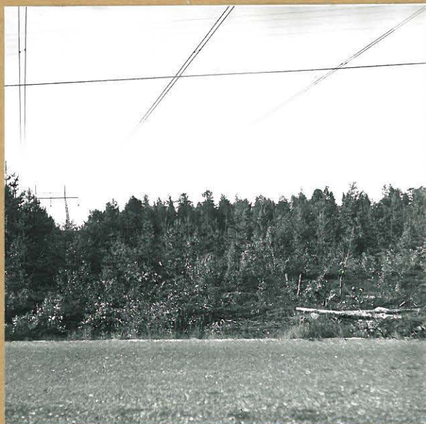
Kuva 2. Asuinpaikka pohjoisesta kuvattuna. Paikka sijaitsee taustalla olevassa metsikössä sähköpylvään pohjoispuolella.