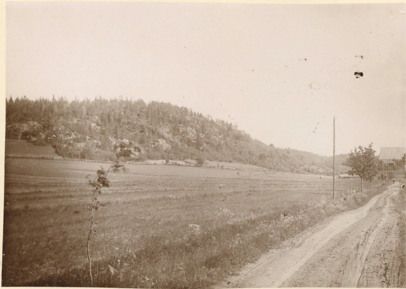
Krejansbärget invid Sjundeå kyrka, sett från vägen till Svedja-gård. Juni 1894.