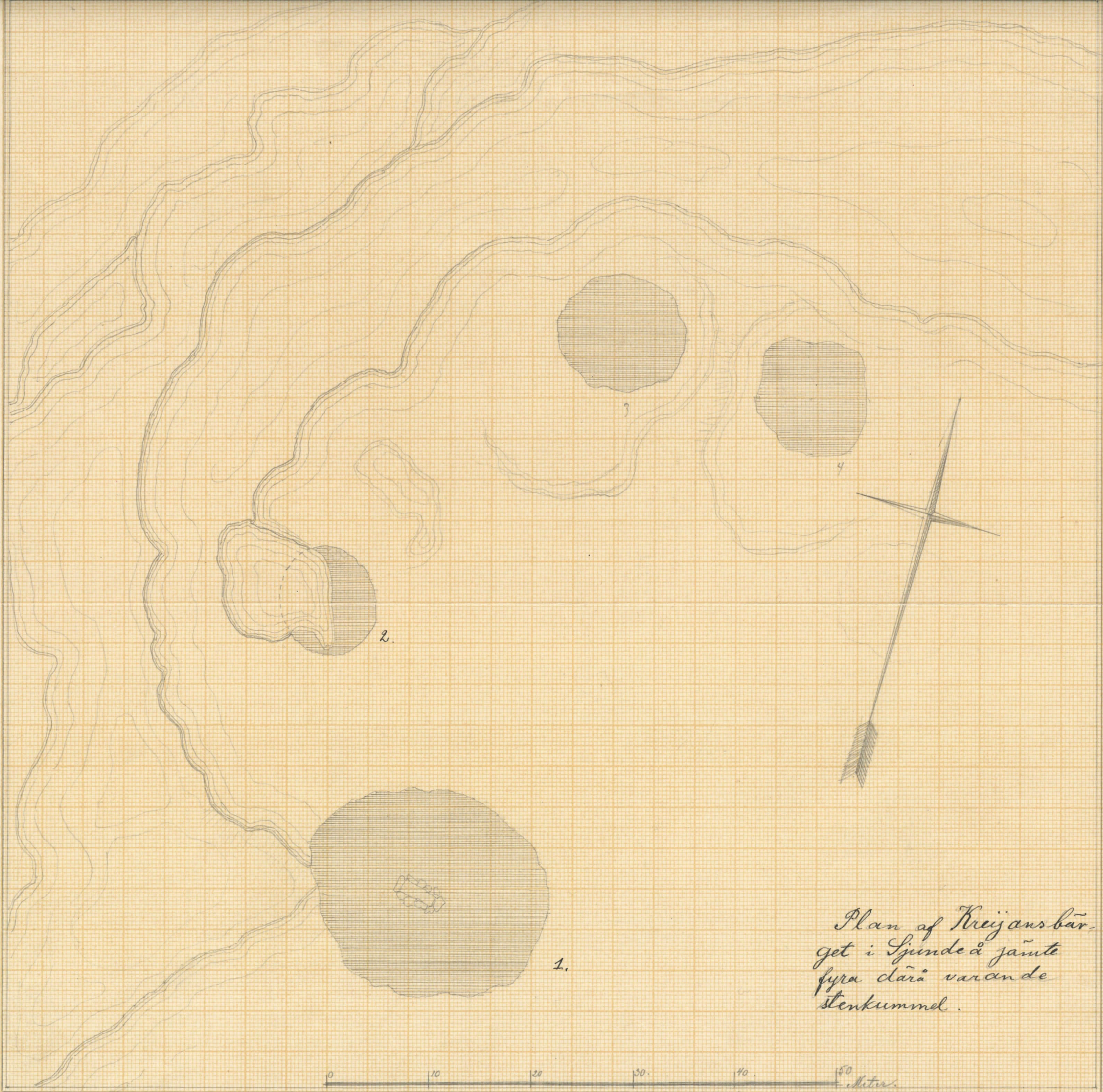
Plan af Kreijansbär- get i Sjunde å jämte fyra därå varande stenkummel.