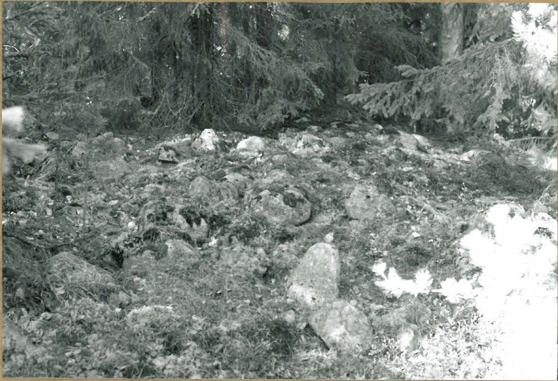
110763 Kuvattu idästä.