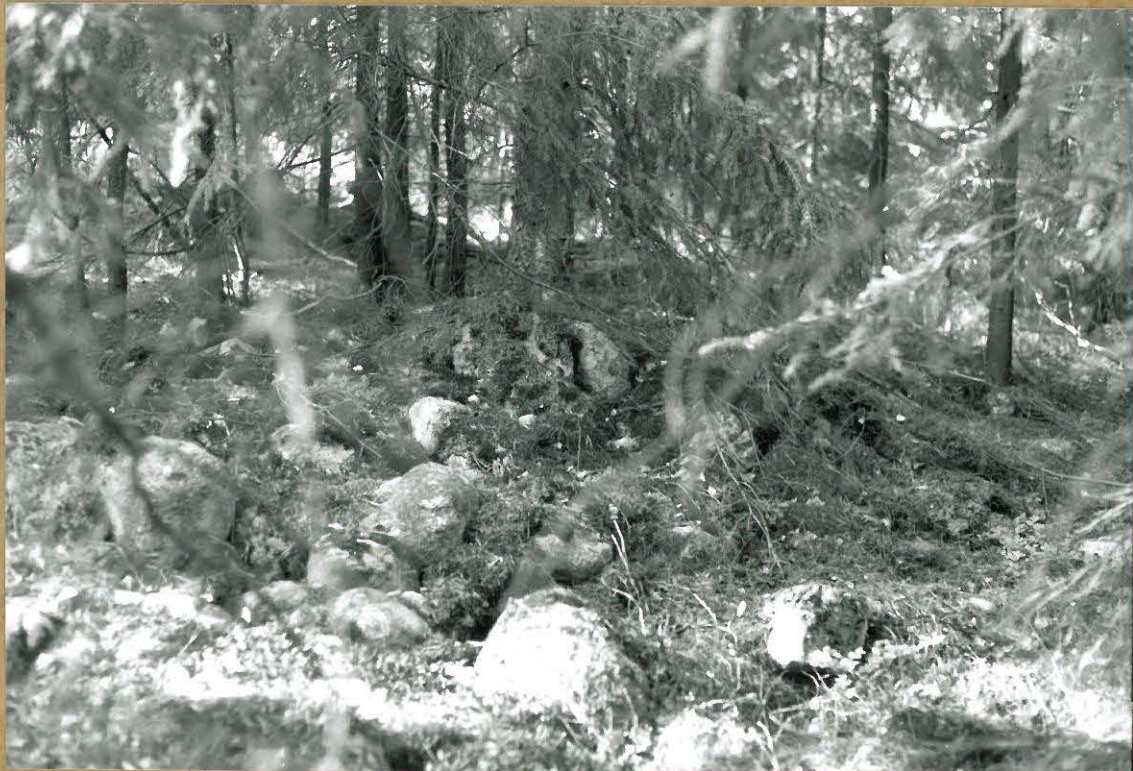
110764 Luoteisreuna. Kuvattu koillisesta.