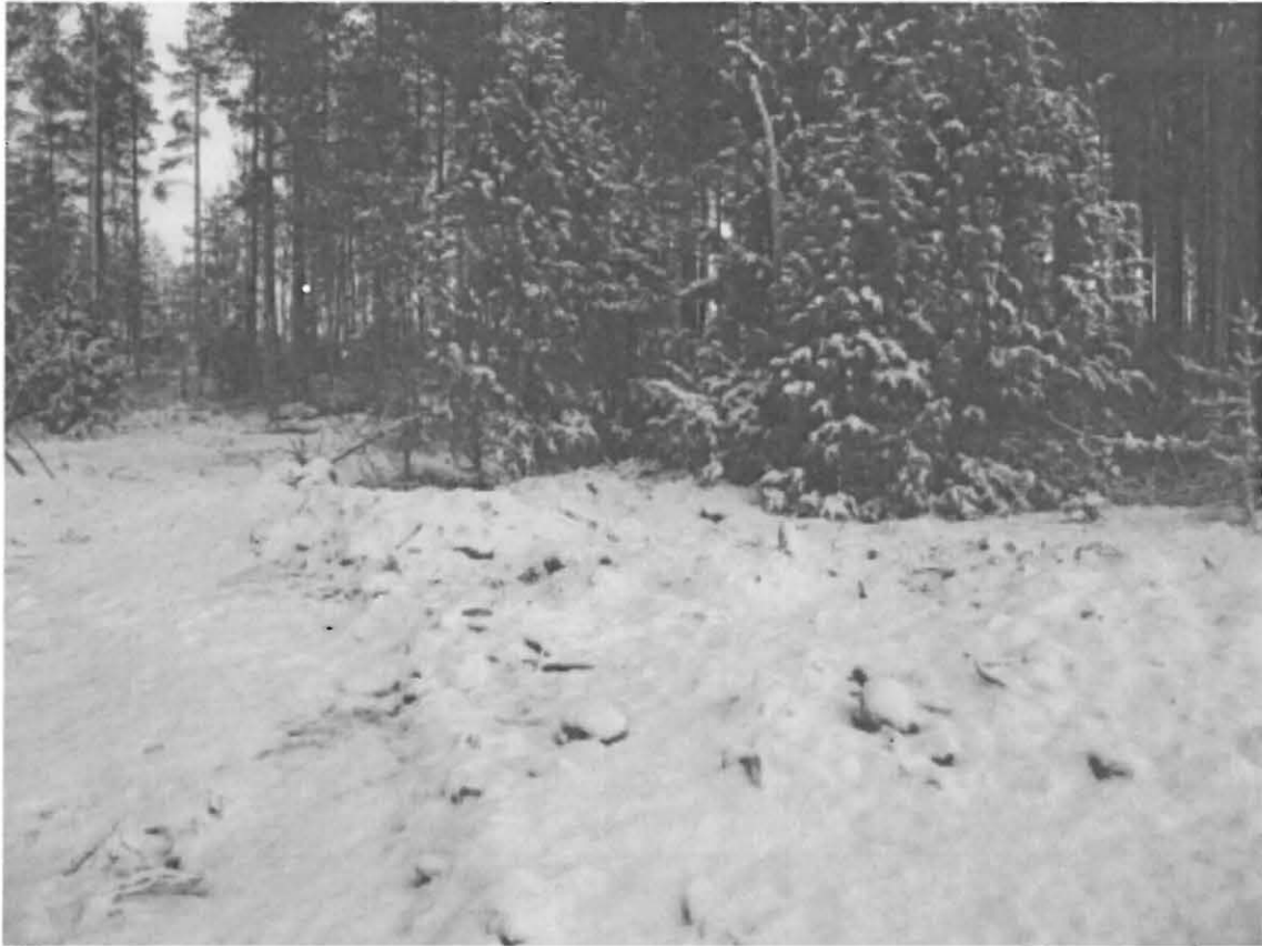
4. Somero, Huhdanmäki 2. Ennestään tunnetun röykkiön aluetta. Vasemmalla tieura. Oikealla katajien juurella irtonaisilta vaikuttaneita lohkokiviä, sammal- ja jäkälämättäitä.