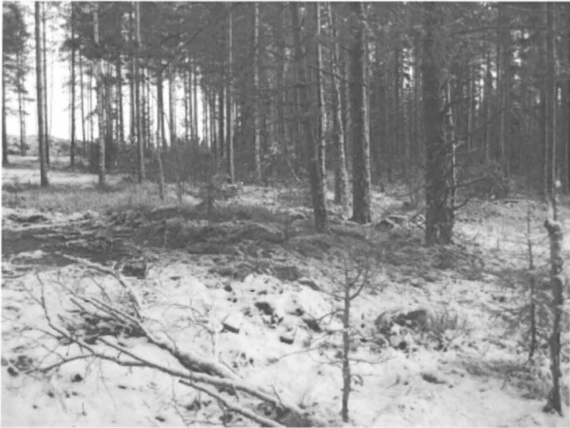
2. Somero, Huhdanmäki 2. Uusi røykkiökohte lounaasta kuvattuna. Vasemmassa ylänurkassa maainesottoalueen maavalleja. Kuva: H. Brusila 2008