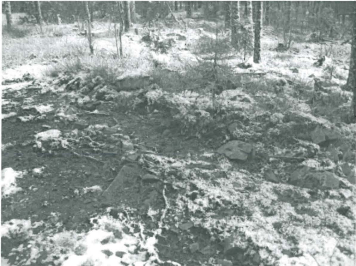
1. Somero, Huhdanmäki 2. Uuden röykkiöhavainnon auki revittyä länsireunaa. Kuva lounaasta. Kuva: H. Brusila 2008

Tutkija Heljä Brusila, Turun maakuntamuseo