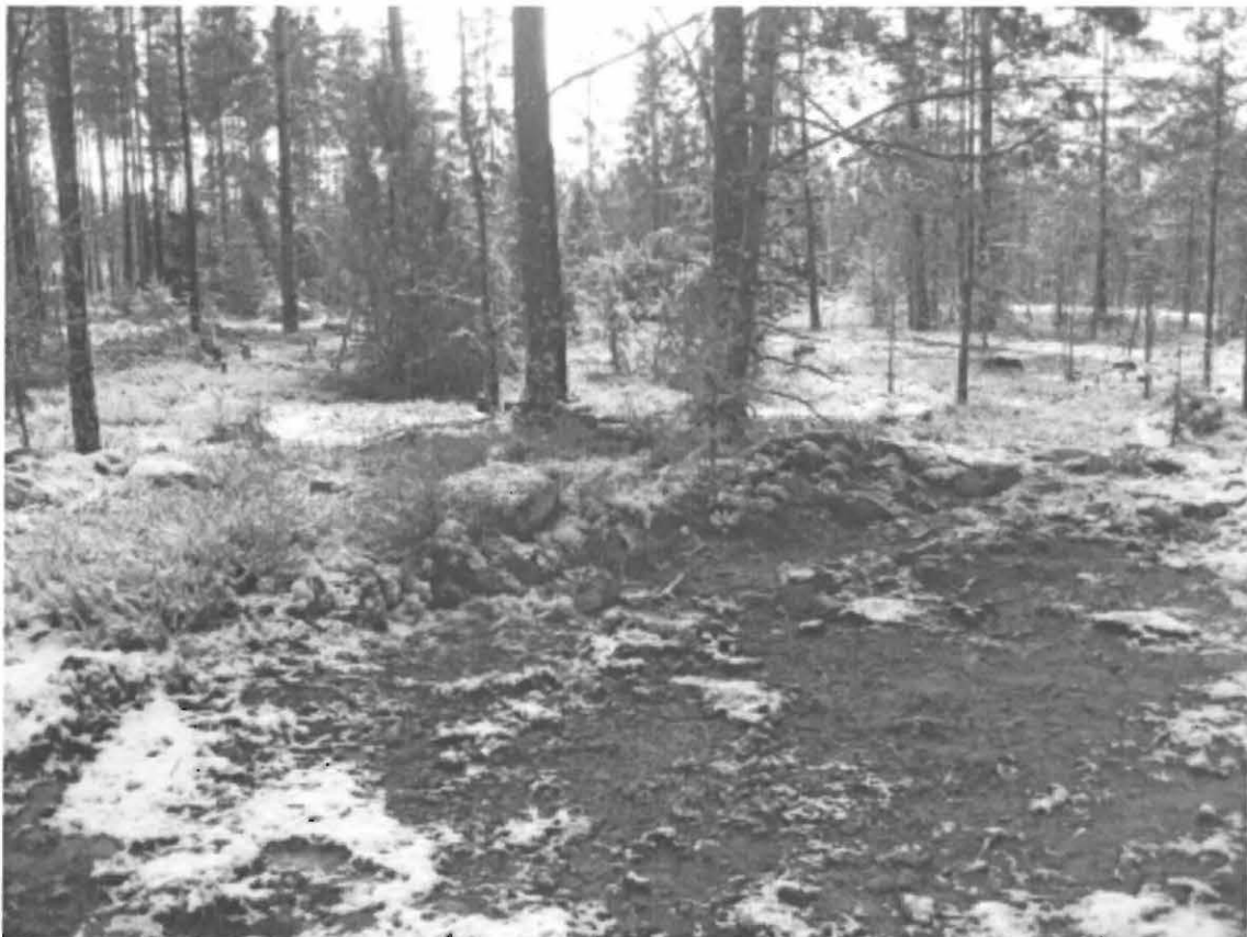
3. Somero, Huhdanmäki 2. Uusi røykkiökohte pohjois-luoteesta. Ennestään tunnettu røykkiö puiden takana kallioterassilla kuvan keskipaikkeilla.