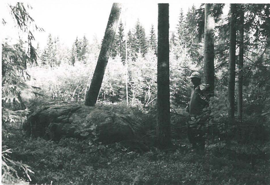
MUKKO PARKKINEN KIVEÄ ESITTELEMÄSSÄ