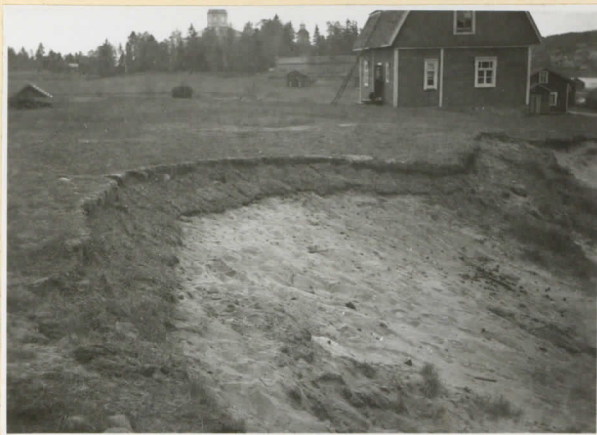
4. Kapakkamäen santakuopan reuna turpeilla vahvistettuna. Valok. luoteesta. Takana Juoksen talo.