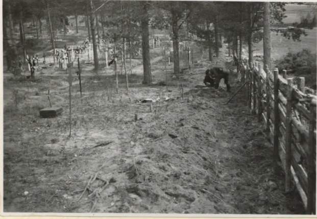
1. Hautausmaan kaakkoisreuna lounaasta. Miesten kohdalla löydöt 9841:1-3.