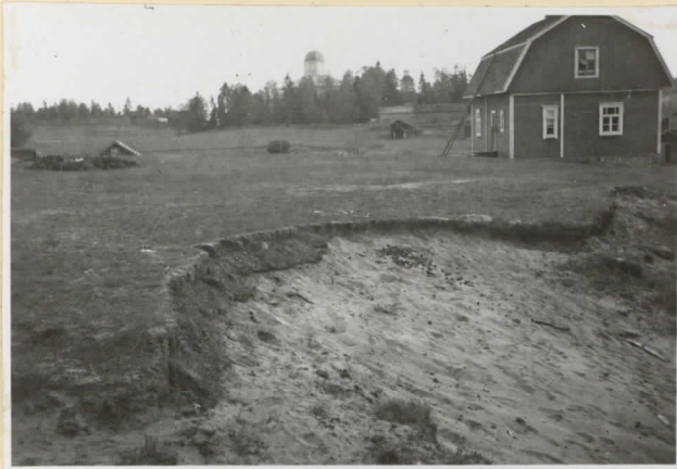
3. Kapakkamäen santakuoppa osittain turvestettuna. Edessä Äyräpään v:n 1927 kaivauksen kaak- koisen pää. Valok. luoteesta.