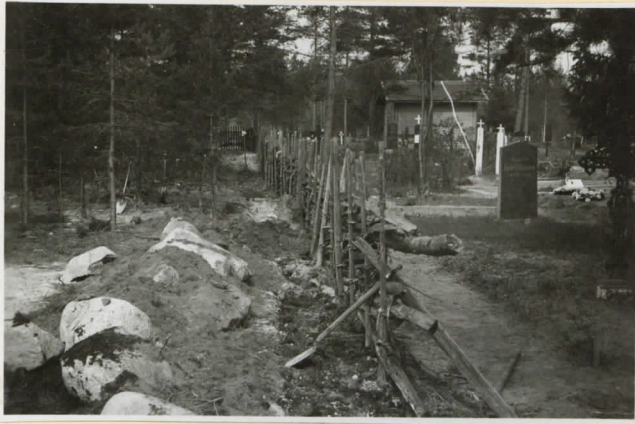
2. Hautausmaan lounainen reuna, Aidanviereinen kiivi kirkolla kuvaa juoksen rajapyytelä ja sen edessä kiveen 9841:4 löytökohta.