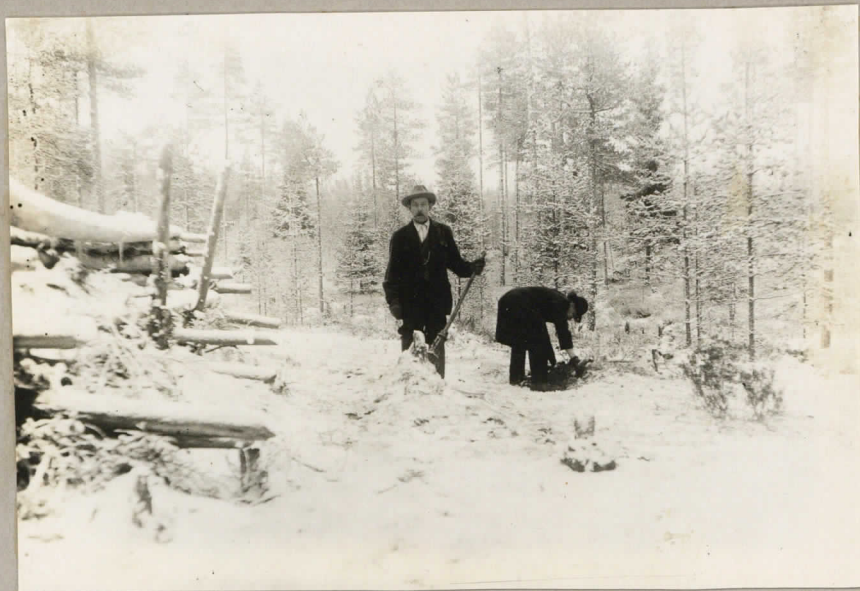
Harmajan Kankaan Kivikautisen asuinpaikka Sulkavalla, ampuma- patterin ympärillä..

Harmajan Kankaan Kivikautisen asuinpaikan kaivaus Sulkavalla J. Ailio Kes. 1930. Suota