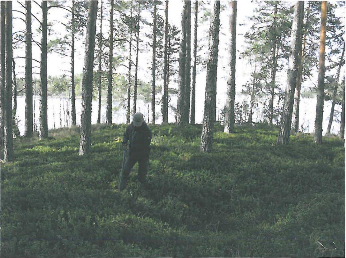
DG 471:2. Saunavirta. Koekuoppaa kaivetaan toiseen kuopanteeseen, kaakosta. 15.5.2008.