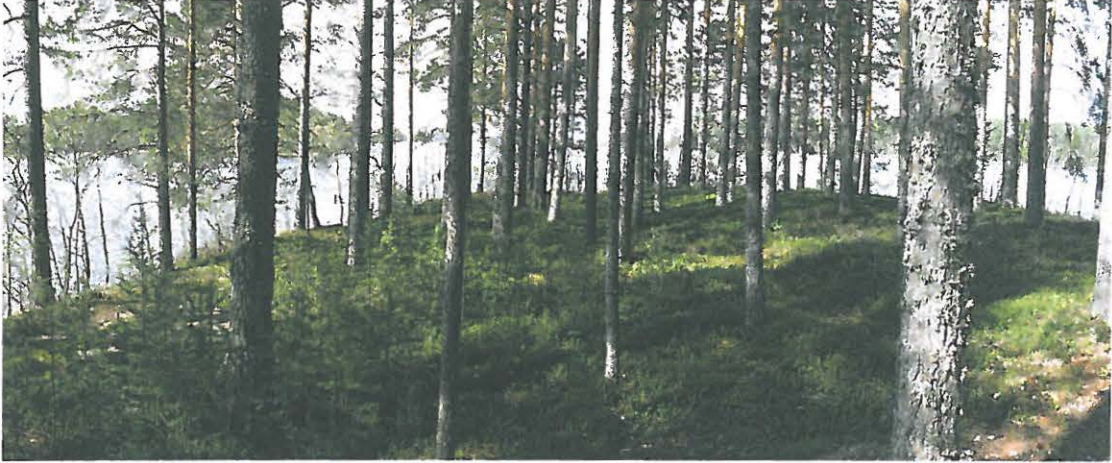
DG 471:1. Saunavirta. Asuinpaikkälöydöt vasemmalta rannalta ja kuopat oikealla harjanteen päässä, kaakosta. 15.5.2008.