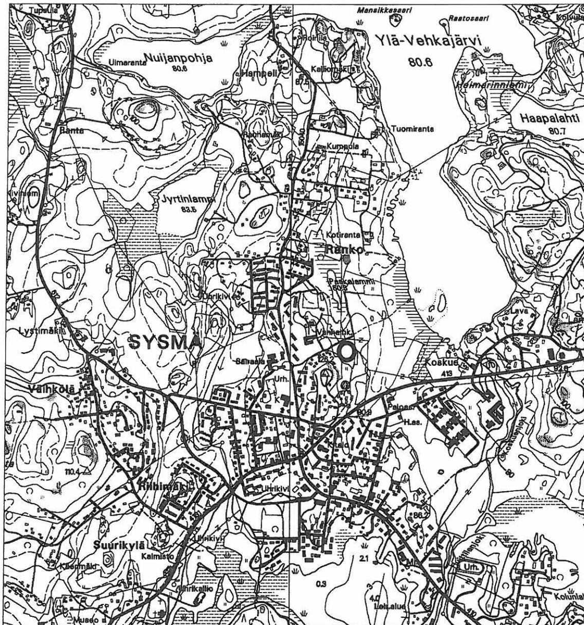
Ote peruskartoista 3121 03 Sysmä ja 3121 06 Valittula Maanmittaushallitus: Perus- ja Käyrät-CD, Mikkelillä 2000 ja 2001.